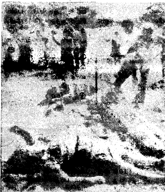
அமெரிக்க ஆதரவுடைய ராணுவ சர்வா கார ஆட்சியினரால் சுட்டுக்கொல்லப்பட்ட நிலையில்

ஸ்பெயின் காலனியாதிக்கத்தின் வளர்ச்சிப்போக்கு ஏனைய காலனியாதிக்கங்களின் வளர்ச்சிப்போக்கோடு பிணைந்தே இருந்தது. இந்தநிலையில் அமெரிக்காவின் வளர்ச்சிப் போக்கும், மற்றும் பிரித்தானியா, ஜேர்மனி, பிரான்ஸ் போன்ற நாடுகளின் வளர்ச்சிப்போக்கோடு ஈடுகொடுக்கமுடியாத ஸ்பெயின் தனது காலனியாதிக்கத்தைக் கைவிடத் தொடங்கியது. இதனால் 1821ஆம் ஆண்டளவில் மத்திய அமெரிக்கநாடுகளிலிருந்து ஸ்பெயின் சுதந்திரம் வழங்குவதாகக் கூறிவிட்டு பின்வாங்கிக்கொண்டது.