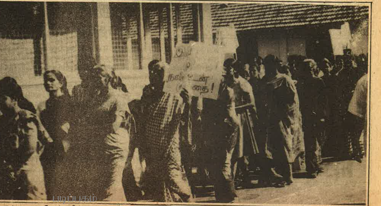
ஒடுக்குமுறையில் சகிக்கமுடியாத பெண்களின் எமக்கிழிப்புக்கள் உணர்வு

எனவே இன்றைய சூழலில் தேசிய இனவிடுதலைப் போராட்டம் கூர்மையடைந்துள்ள வேளையில் முன்னணியில் இருக்கும் சக்திகளை இனம் பிரித்து சாதாரண மக்களின் உண்மையான நலன்களைப் பிரதிபலிக்கும் சரியான சக்திகளுடன் இணைந்து அவற்றைப் பயன்படுத்துவதன் மூலம் பெண் விடுதலைக்குரிய பாதையை விரைவுபடுத்தலாம். அத்தகைய சக்திகளின் சீரிய செயற்பாடே ஈழப் போராட்டத்தை நிதர்சனமாக்கும்.