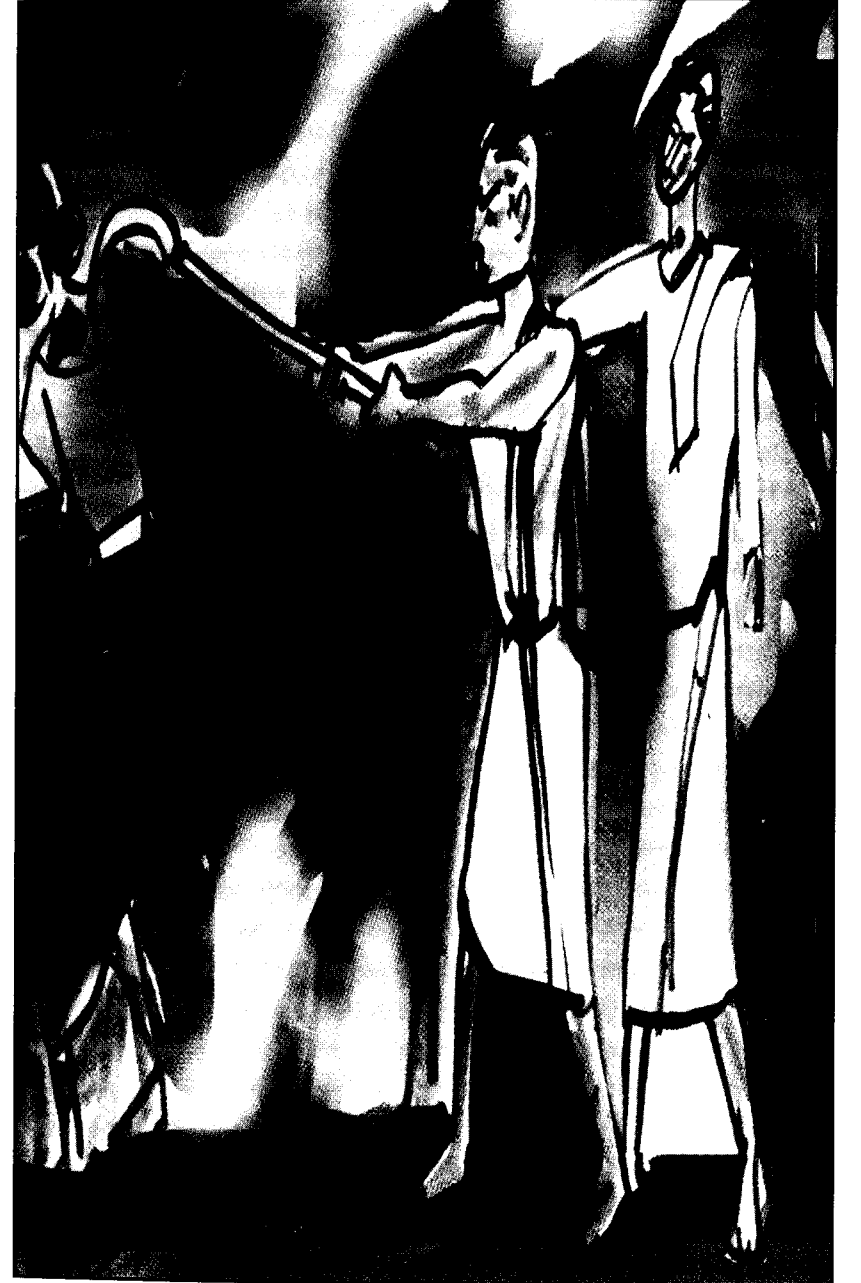
ஓவியம்: கே டானியல் நினைவு மலர். நன்றி