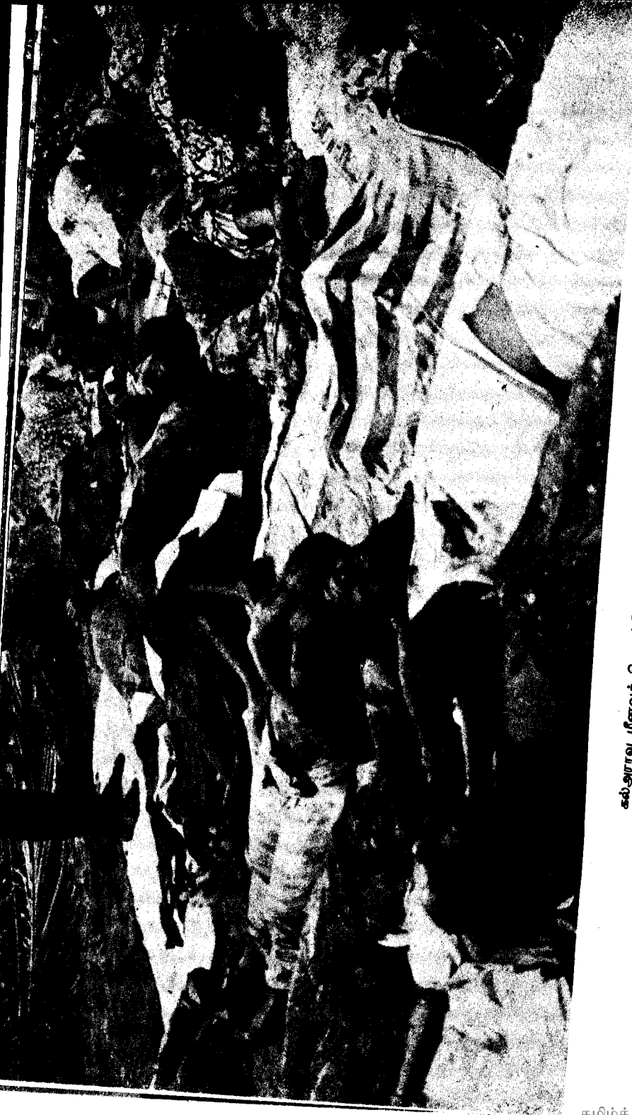
கல்அராவ மீனவக் கிராமத்தில் சிங்களக் குடியிருப்பாளர்களைக் கொலைசெய்தல்