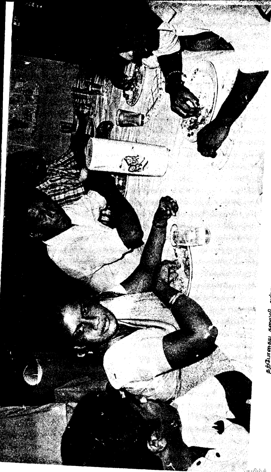
தற்போதைய தலைவி அன்று சமாதானத்திற்காகத் தமிழ் இயக்கங்களைச் சந்தித்தல்