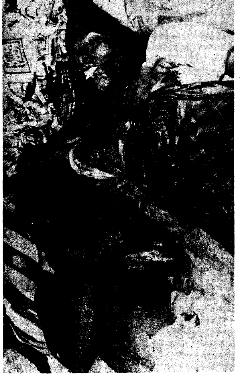
கொக்கட்டிச்சோலைக் கிராமத்தில் தமிழக குடியிருப்பாளர்களைக் கொல்லுதல்

www.tamilaranga.net இனவாதினரால் அழிவுக்குட்பட்டது இந்தப் பொருட்கள் மட்டுமா ?