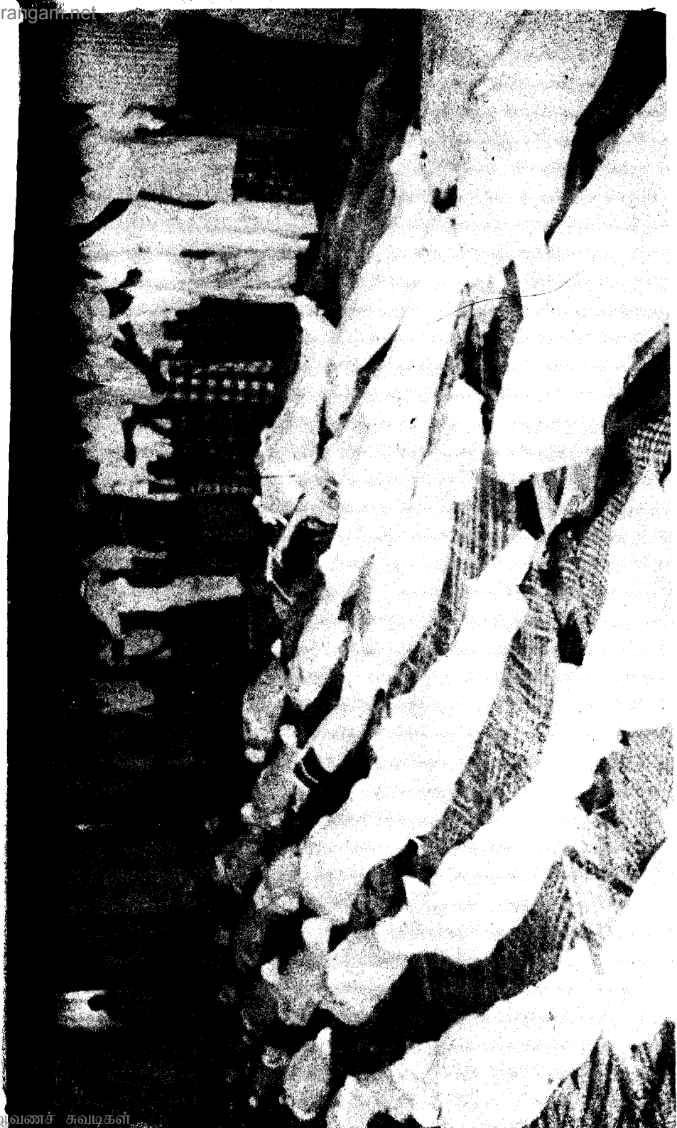
காத்தான்குடி முஸ்லிம் பள்ளியினுள் இடம்பெற்ற மனிதக் கொலைகள்