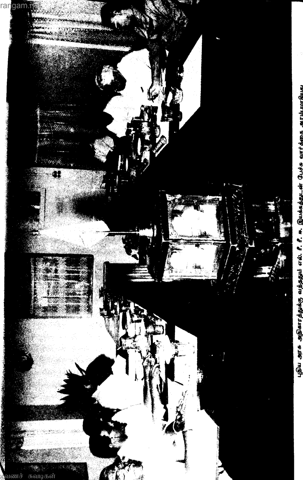
புதிய அரசு அதிகாரத்துக்கு வந்ததும் எல். ரீ. ஈ. இயக்கத்தின் பேச்சு வார்த்தை - அரம்பரையினர்