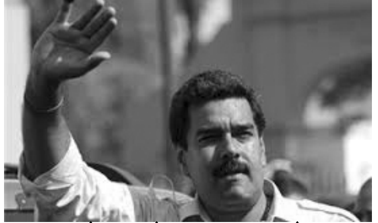
நிக்கோலஸ் மதுரோ மோரோஸ்

தென் அமெரிக்க நாடான வெனிசூலாவில் பொலிவோரிய புரட்சியை (Bolivarian Revolution) நடாத்தி, அந்த நாட்டை முற்போக்குப் பாதையில் வழிநடாத்திய மக்கள் அபிமானம் பெற்ற புரட்சித் தலைவர் ஜனாதிபதி ஹியூகோ சாவேஸ் புற்று நோயால் காலமானதைத் தொடர்ந்து, அந்த நாட்டில் 2013 ஏப்ரல் 14ஆம் திகதி நடைபெற்ற ஜனாதிபதித் தேர்தலில், அந்நாட்டு சோசலிஸ்ட் கட்சியின் புதிய தலைவர் நிக்கோலஸ் மதுரோ மோரோஸ் (Nicholas Maduro Moros) வெற்றி பெற்றுள்ளார்.