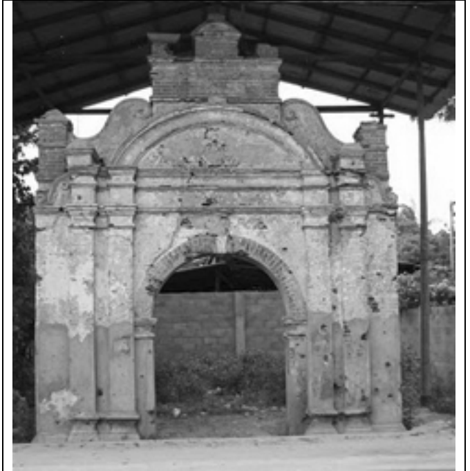
சங்கிலியன் அரண்மனை முகப்பு

அதற்கு முன்பே தமிழ் காங்கிரஸ் - தமிழரசுக் கட்சிகள் அந்தக் கைங்கரியத்தைத் தாராளமாகச் செய்து வந்துள்ளன. உதாரணமாக முஸ்லீம் மக்களைப் பார்த்து