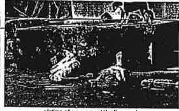
victims of government death squads

THIS MAN HAS PRESIDED OVER A GOVERNMENT WHICH HAS SUMMARILY EXECUTED OVER 100,000 PEOPLE* ORGANISED DEATH SQUADS TO ELIMINATE POLITICAL OPPONENTS AERIAL BOMBED RESIDENTIAL AREAS KILLING TENS OF THOUSANDS REFERRED TO THE AMNESTY INTERNATIONAL AS A TERRORIST ORGANISATION