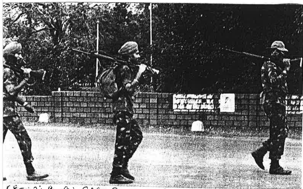
(நேருமிய் கோட்டம் திந்திய திராணுவம் ) திலக்காகமிருந்து காவுக்கேடு கொழிபயா?)

பேச்சுவார்த்தையை நியாயப் படுத்துவதற்காக சர்வதேச அரங்கில் முரண்பாடுகளை 'பேசி தீர்த்துக்' கொள்ளவேண்டும் என்ற கருத்து மேலோங்கி இருப்பதைக் குறிப்பிட்டு இக் கருத்துக்கு உறுதுணையாக ஏகாதிபத்தியங்களுடன் இணைந்து கோர்ப்பச்சேவ் கும்பல் நடாத்தும் ஏகாதிபத்திய விஸ்தரிப்பையும், ஏகாதிபத்தியங்களின் கைக் கலிகளாகவிட்ட தலைமையையும் துணைக்கழைக்கின்றனர். இங்குமறை முகமாக வைக்கப்படும் கேள்வி என்னவெனில் 'பெரும்பான்மை மக்களின் பிரதிநிதிகள்' என்ற முகமுடியைக் கழட்டி வைத்துவிட்டு உலகளாவிய ரதியில் அதிகா