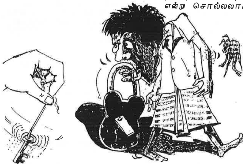
காலக்காலில் சினையகம் !!