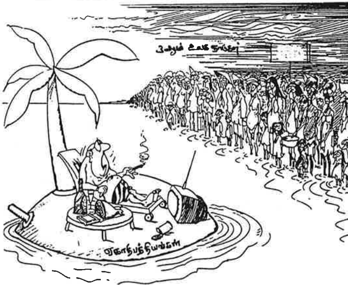
(42 ஆம் பக்கம் பாருங்கள்)

இந்த அபாயத்தை எதிர்க்க, உண்மைகளை வெளிச்சம் போட்டுக் காட்டுவோம். இலங்கையில் இல்லாத, வெளிநாடுகளில் ஓரளவுக்கு இருக்கின்ற கருத்திச் சுதந்திரத்தை சரியானவழியில் முழுமையாகப் பாவித்து, எதிரிகளை மக்களுக்கு இனம் காட்டி, அரசாஜகம், பாசிசத்திக்கெதிரான குரலைப் பலப்படுத்தவோம்.