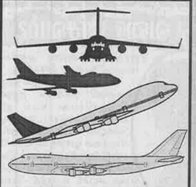
ஓவ்வொரு வருடமும் 'பிரிட்டிஷ் எயர்வேஸ்' விமான நிறுவனத்தின்

விமானங்களில் ஒரு கோடி பேர் பயணம் செய்கிறார்கள். இதில் ஒரு மணித்தியாலத்தில் 1200 பயணிகள் என்ற கணக்கிற்கும் அதிசயம். இந்த நிறுவனத்தின் விமானங்களில் வருடம் ஒன்றிற்கு 40 தொன் பழச்சாறு பரிமாறப்படுகிறது. இதைவிட 125 தொன் ஆட்டினைச் சிடியும், 41 தொன் சோழி இறைச்சியும், ஒரு கோடியே 2 இலட்சம் சொக்கிளேட் பார்சுகளும், ஸ்டிரோபெர்ரி பழங்கள் 50 தொன் போன்றவையும் பரிமாறப்படுகின்றன. அதிக பயணிகள் சாதனை மட்டுமன்றி, பயணிகளைச் சமந்து செல்வதன் மூலம் உலகில் அதிக வருமானம் குவிக்கும் விமான நிறுவனமும் 'பிரிட்டிஷ் எயர்வேஸ்' தான்.