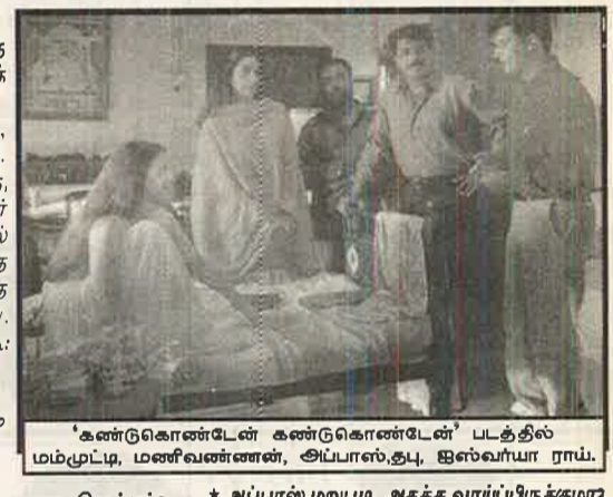
* கண்டுக்கொண்டேன் கண்டுக்கொண்டேன் படத்தில் மம்முட்டி, மணீவண்ணன், அப்பாஸ்து, ஐஸ்வர்யா ராம்.