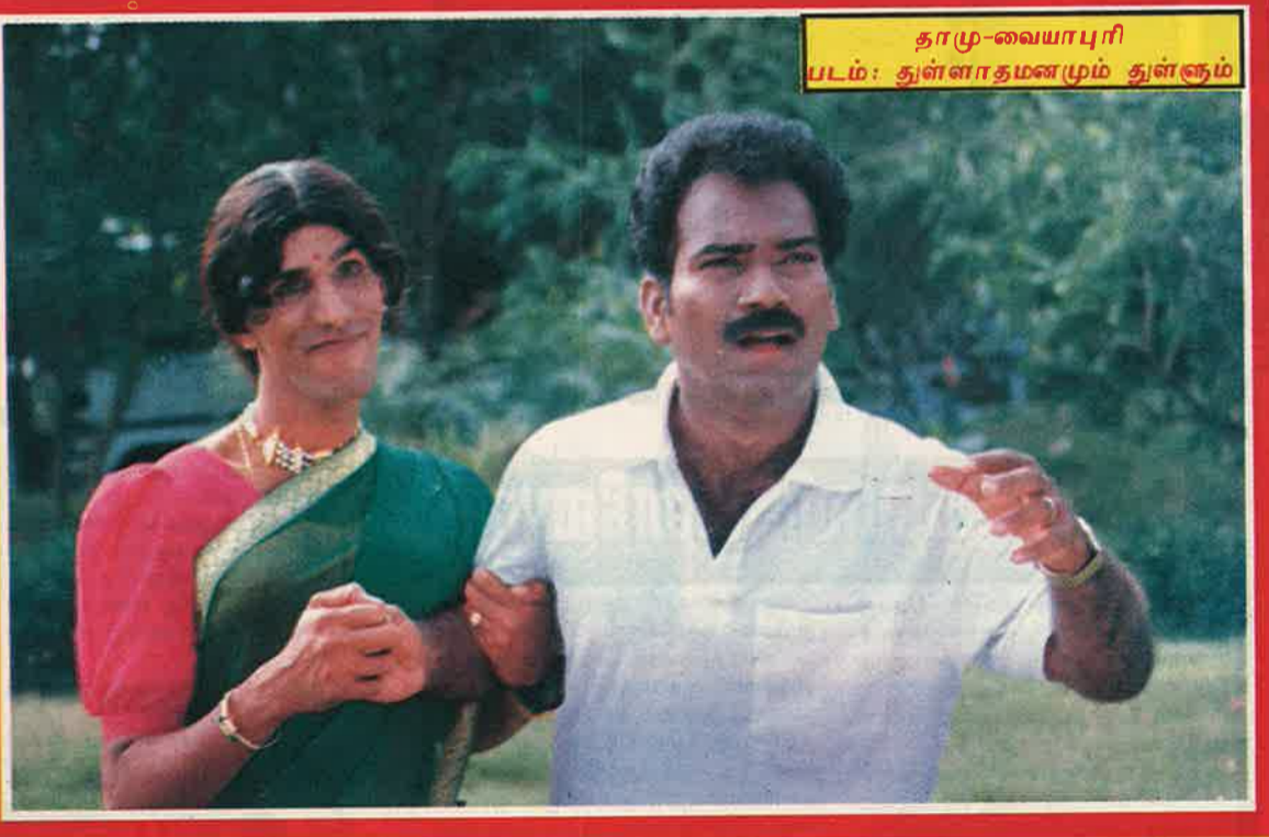
தாமு-வையாபுரி படம்: துள்ளாதமனமும் துள்ளும்

தற்போது 'விரலுக்கு ஏற்ற வீக்கம்' படத்தில் கனகாவுக்கு ஜோடி வடிவேலு. கனகாவின் நிலையைப் பார்த்தீர்களா? கதாநாயகியாக இருந்தவர் கவர்ச்சி நடிக்கையாக 'தலைமுறை' படத்தில் தோன்றினார். இப்போது நகைச்சுவை நடிக்கையாக மாறிவிட்டார். பொறுத்திருந்து பாருங்கள். நகைச்சுவை கதாநாயகியாக கலக்கிக் காட்டுகிறேன் என்கிறாராம் கனகா. இந்த சவால் தானே வேண்டாமென்கிறது.