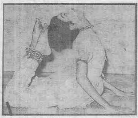
நேற்ற நாட்டிய நாயகன் இன்று நடப்புலக நாயகன்