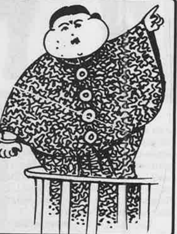
செ: இதற்கான பதிலை கலைஞர் தான் கூறவேண்டும். நீ: ஏன் அவர் கூறவேண்டும்? செ: புலிகளது நடமாட்டத்தை எப்போது கட்டுப்படுத்தி முடிப்பார் என்பதை அவர் கூறட்டும். பின்னர் நான் கூறுகிறேன் பதிலை. (நீதிபதிக்கு தலை சுற்றுகிறது)

செல்வி: ஹா ஹா ஹா, வழக்கு, கணக்கு, பிணக்கு யாரிடம் நடத்துகிறீர்கள் விசாரணை? யாரிடம் அனுப்புகிறீர்கள் சம்மன்? நீதிபதி: நான்தான் நீதிபதி. செல்வி: நீர் நீதிக்கு அதிபதி. நான் நாட்டுக்கே அதிபதி. நான் விரலசைத்தால் அரகம் ஆடும். அமைச்சர்களின் சிரகம் ஆடும். நீ: அதிகாரமான பேச்சு செ: அது என் கூடப்பிறந்த குணம். நீ: நீதிக்கு தலை வணங்குங்கள்! செ: என் முன்னால் அடுத்தவர் தலை வணங்கித்தான் பார்த்திருக்கிறேன். என்னையே தலை வணங்கச் சொல்கிறார்? நீ: உங்கள் வழக்கு பற்றி என்ன கூறுகிறீர்கள்? செ: தமிழ் நாட்டில் புலிகள் நடமாட்டம் அதிகமாகி விட்டதால் நான் எக் கேள்விக்கும் பதில் சொல்ல முடியாது. நீ: அதற்கும் இதற்கும் என்ன சம்மந்தம். செ: புலிகள் குறிவைக்கக்கூடும் என்று பயந்து கொண்டிருப்பதால், உங்கள் கேள்விகளுக்கு சரியாக பதிலளிக்க முடியாது. நீ: எப்போதான் பதில் கூறப்போகிறீர்கள்?