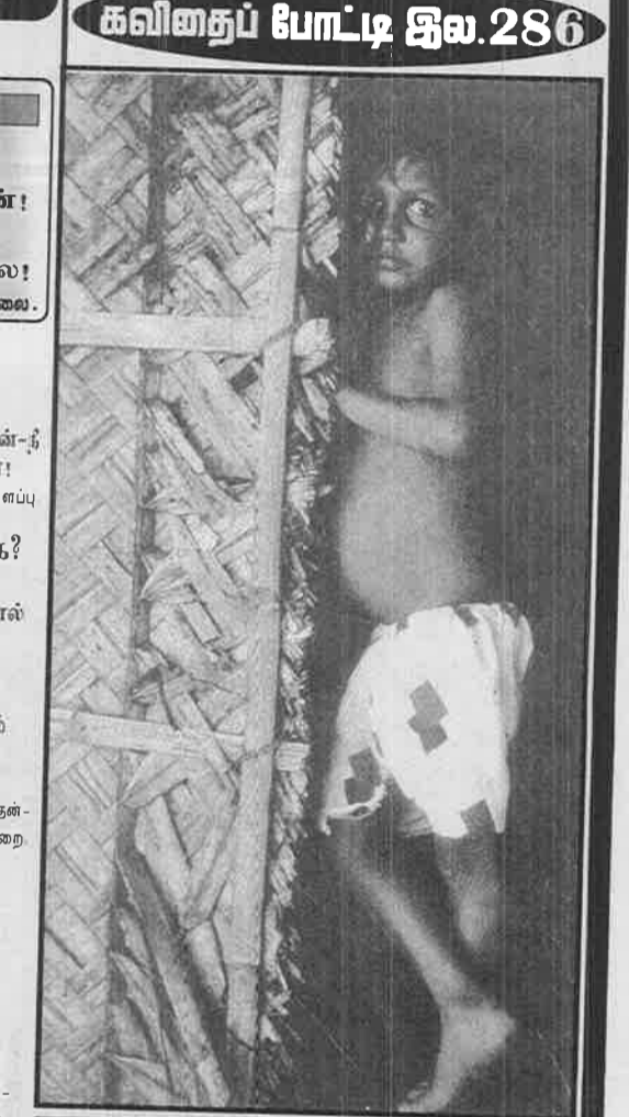
எண்ணத்தில் தோன்றும் கவிதைகளை வாசிப்பதற்கான எண்ணிக்கை அதிகமில்லாமல், தபாலட்டையில் மட்டும் பதிவு செய்து அனுப்பி வைப்புகள். அனுப்பப்படவேண்டிய கடைசித் திகதி: 12.12.1998 முகவரி: கவிதைப் போட்டி இல.286 தினமுரசு, வாரமலர், த.பெ. இல-1772, கொழும்பு.