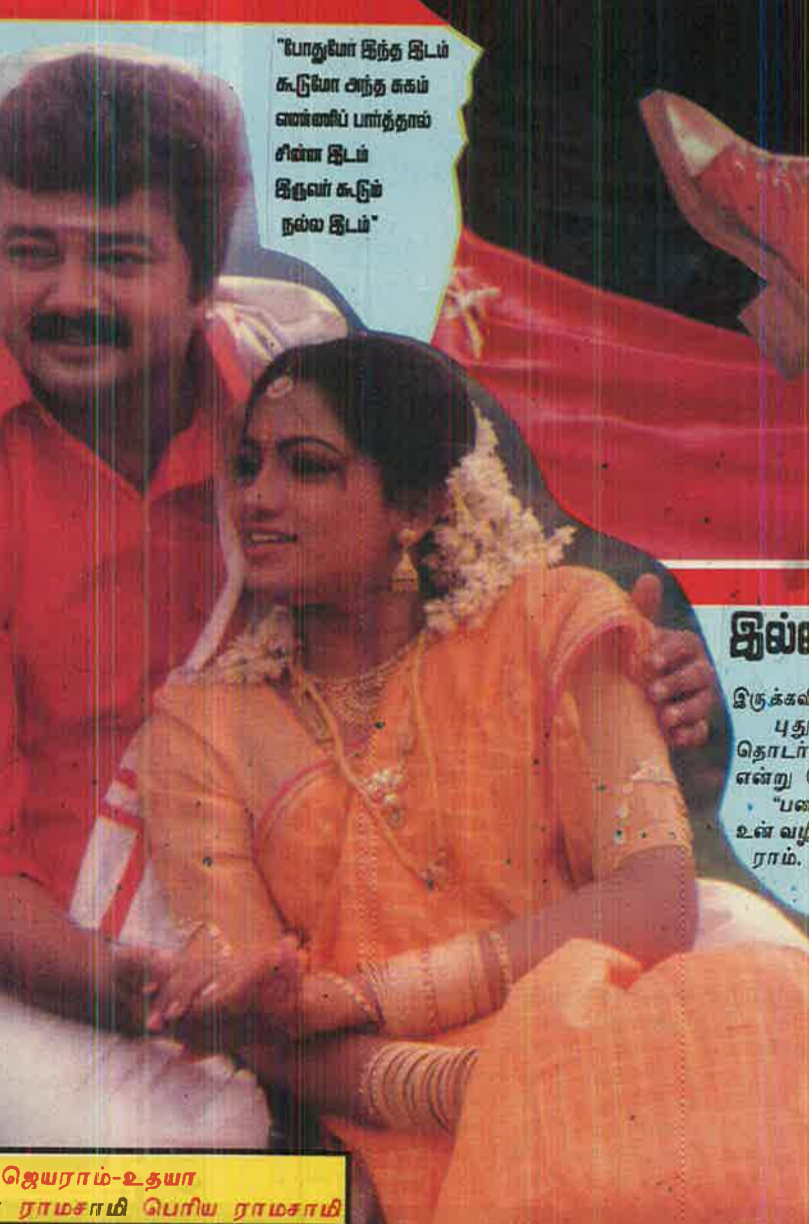
ஜெயராம்-உதயா படம்: சின்ன ராமசாமி பெரிய ராமசாமி