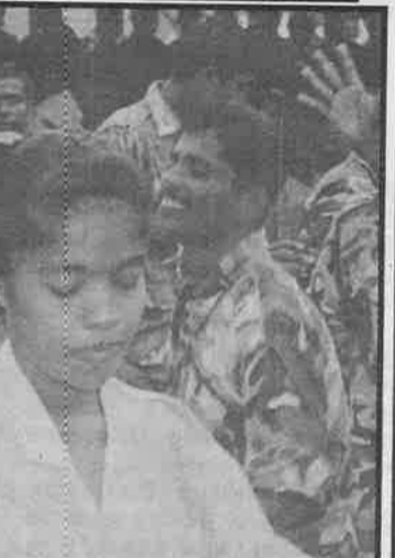
வவுனியாவில் இராணுவத்தினர் மத்தியில் 'பைலா' குதரகலம் அமைச்சர்களும் பங்குகொண்டு ஆடினார்கள். பெண் சிப்பாய் ஒருவர் 'பைலா' பாட்டுக்கு ஆடுகிறார்.