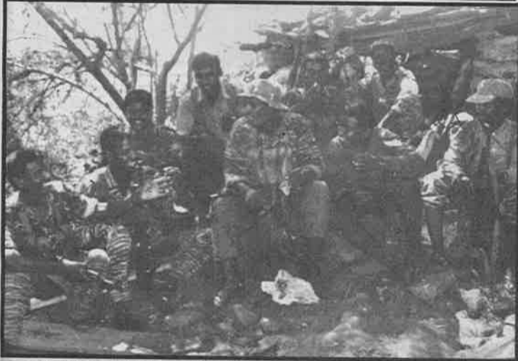
புலிகளின் முகாம்களிலும் மகிழ்ச்சிக்கு குறைவில்லை. ஆனால் 'பைலா' ஆட முடியாத, எழுச்சிப் பாடல்களை மட்டுமே பாட முடியும். அப்போதும் ஆயுதம் கையில் இருக்கும்.

போரை நடத்துவதில் ஜெனரல் ரத்தலத்தை சற்றும் குறையாத ஆர்வமும், ஈடுபாடும் ஜனாதிபதி சந்திரிகாவுக்கும் இருக்கிறது. அதனை அவர் வெளிப்படுத்தியும் வருகிறார். தமிழில் மட்டுமல்ல சில விமர்சகர்களும், கட்சிகளும் ஜனாதிபதியின் ஈடுபாட்டைக் கூறக் கூச்சப்படுகின்றனர். யாழ் குடாநாட்டுப் பயணிகளுக்கு கப்பல் சேவை விடுமாறு தமிழ்க் கட்சிகள் கேட்ட போது, 'போர் நடக்கிறது. படை மின்ருக்கே முன்னுரிமை தரமுடியும்' என்று திட்டவாடமாக கூறினாராம் ஜனாதிபதி. '90 வந்தமான யுத்தம் முடிந்து விட்டது' என்றும் தென்னிந்தியக் கூட்டங்களில் ஜனாதிபதி கூறியிருக்கிறார். 'ஜயசிக்குறைய்' வெற்றிச் செய்தியை கொண்டு வந்து ஜெனரல் ரத்தலத்தை ஜனாதிபதியிடம் கொடுப்பார். அதே சூட்டோடு வாக்குச் சீட்டுகளை வாக்காளர்களிடம் கொடுத்த தேர்தலில் வெற்றிச் செய்தியை பெற்றுவிட வேண்டும் என்பதுதான் ஆளும்