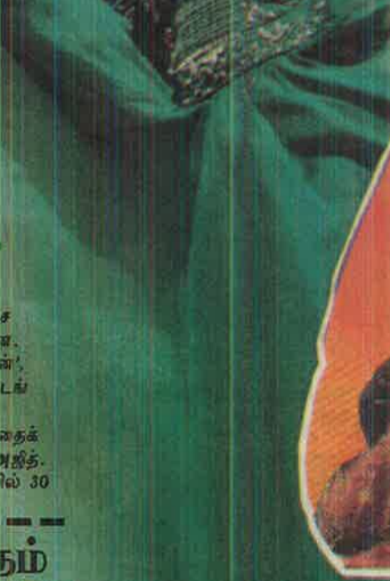
அர்ஜுன்-சிம்ரான் படம் கொண்டாட்டம்