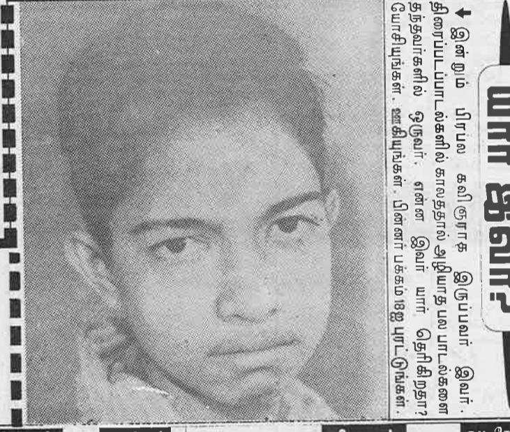
யார் இவர்? இன்றும் பிரபல கவிஞராக இருப்பவர் இவர். திரைப்படங்களில் காலததால் அறியாத பல பாடல்களை யோசிப்பார்கள். ஊழியர்கள். பின்னப்பக்கம் 18 இடம் காண்க.