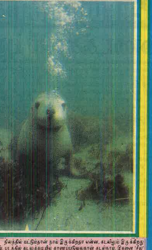
தலைத்தில் வாழும் நாய்களை கடலில் தூக்கிப்போட்டுப் தீந்தி கரைக்கு வந்துவிடும். கடலில் அவற்றால் சீக்க முடியாது. ஆனால் கடல் நாய்கள் தீரில் யூட்டியால் தலைத்திலும் வாழக்கூடியவை என்பதற்கான விசையும். கடல்நாய்களுக்கு தவிதாக சீப்பது என்றால் போர் அடிக்கும். அதனால் கட்டும் கட்டடங்களை காணப்படுகின்றன. சிலவையான கடல் நாய்கள் மீண்டும் தவிமை விந்துவிகள்.

விஷால் கூடைப்பந்து விளையாட்டில் பழம் தீன்று கொண்ட போட்டவர் மைக்கேல் ஜோர்டான். 10 ஆயிரம் புள்ளிகளைத் தாண்டிய சாதனையாளர்களில் ஒருவர். மொத்தம் 24 ஆயிரத்தி 489 புள்ளிகள் பெற்றிருக்கிறார். 766 போட்டிகளில் பங்கேற்றவர். சராசரி புள்ளிகள் 31.9. 1984 முதல் 1996 வரை கண்டெடுக்கப்பட்ட சாதனைப் பட்டியல்தான் இவை. 1994 செப்டம்பர் 18ம் திகதி அமெரிக்க ஒக்லஹோமா மாநிலத்தில் பெத்தவர் என்றும் இடத்தில் தடைபெற்ற போட்டியில் உலக சாதனை ஒன்றை படைத்து அசத்தினார். ஒரு நிமிடத்தில் முக்கிய புள்ளிகள் பெறும் ஏழு நினைகளில் தீன்று 29 தடவை பந்து விசி. அதில் 25 பந்துகளை யாவகமாக கூடைக்குள் செலுத்தியதான் சாதனை. மற்றொரு கறுப்பு வைரம் மஜிக் ஜோன்சன். 'எய்ன்' இருப்புதற்கு பரவிய செய்தியால் பெரிதும் பாதிக்கப்பட்டவர். மஜிக் ஜோன்சனுக்கு 'எய்ன்' இருப்பதால் அவருடன் விளையாடாமல்டோம் என்றெல்லாம் சக வீரர்களே பயந்து அலறினார்கள். அவ்வாறு இருந்தும் ஒலிம்பிக் கழகம் மஜிக் ஜோன்சனை 1992ல் பார் சிலவானா ஒலிம்பிக்வில் விளையாட அனுமதித்தது. அமெரிக்க கூடைப்பந்து விளையாட்டு வரலாற்றில் இரண்டு கறுப்பு வைரங்களும் என் றென்றும் பிரகாசித்துக் கொண்டிருக்கும்.