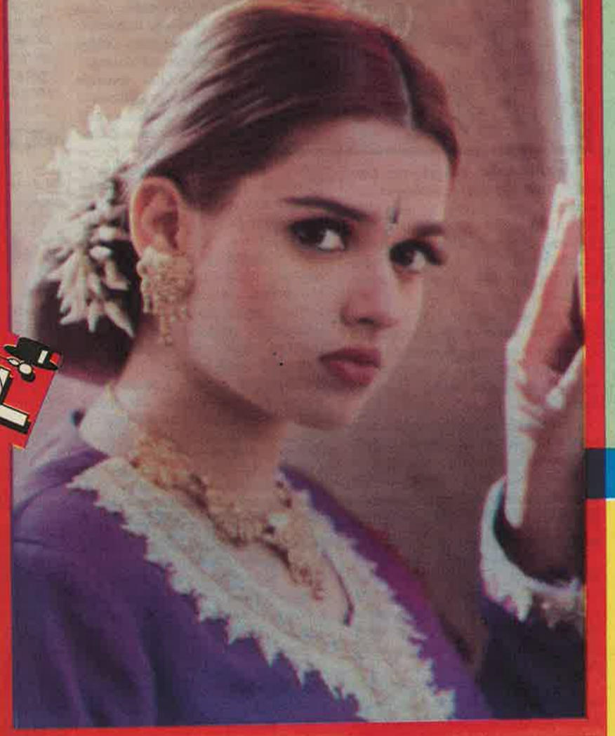
ரீவா படம்: ரோஜா மலரே

புருவம் என்னும் வில்லெடுத்து பூவிழி என்னும் கணைதொடுத்து பருவம் என்னும் அழகிய தேரில் பாலை வந்தாள் படவெடுத்து!