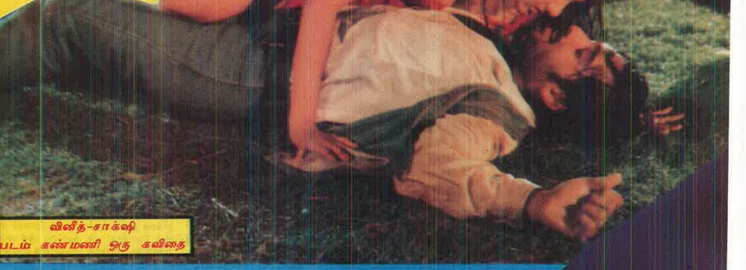
வினித்-சாக்ஷி படம் கண்மணி ஒரு கவிதை

நடிகரின் மூகம் ஏக கோணலாகிவிட்டது. எப்படி வெளியே வ என்பது அவருக்கே தெரியவில்லை. கார் டிக்கியில் நடுகை திருமணத்தின் பின் நடிப்பதை நிறுத்திவிட்டு கணவ அமெரிக்கா சென்ற நான்கெழுத்து 'அயி' நடிக்க அங்கு குழந்தையும் பெற்றுக் கொண்டார். இப்போது மீண்டும் வந்துள்ளார். இவர் முன்னர் நடித்ததுகொண்டிருந்தபோது ஒவ்வொரு படமும் ஒரு கதாநாயகரை இரட்சகராக வைத்திருந்தமீதும் ஒரு சில ஹீரோக்கள் தவிர எல்லோருடனும் கிசகி பட்டவர். முன்னணி ஏழு நடிகர்களில் நால்வர் அதில் அட இத்த நடிகை முன்னெழுத்து வாரிக நடிகருடன் மிககிக்கப்பட்டபோது ஒரு நாள் நடிகை, நடிகரின் கார் டிக்கி ஏறிச் சென்றார். அதெல்லாம் நடிகைக்கு சாதாரண விஷய நடிகையின் தங்கை அக்காவுக்கு நேர் எதிர்த். எத்தனை ஹீரோக்கள் முயன்று பார்த்தும் படியாதவர். முதல் பட கதாநாயக மட்டும் (காதல் அலைகள் இயவதில்லை என்று) காதலித்தவர் த பின்னர் மலையாளத்தில் நடிக்கச் சென்றபோது அங்குள்ள நாயகர் ஒருவரைக் காதலித்தார். அதை அறிந்த தாயார் நடிகை வேறொரு மணமகன் பார்த்து திருமணம் செய்து வை காரணம் குறிப்பிட்ட நடிகரின் தந்தையருடன் நடிகையின் த நட்பாக இருந்தவராம்.