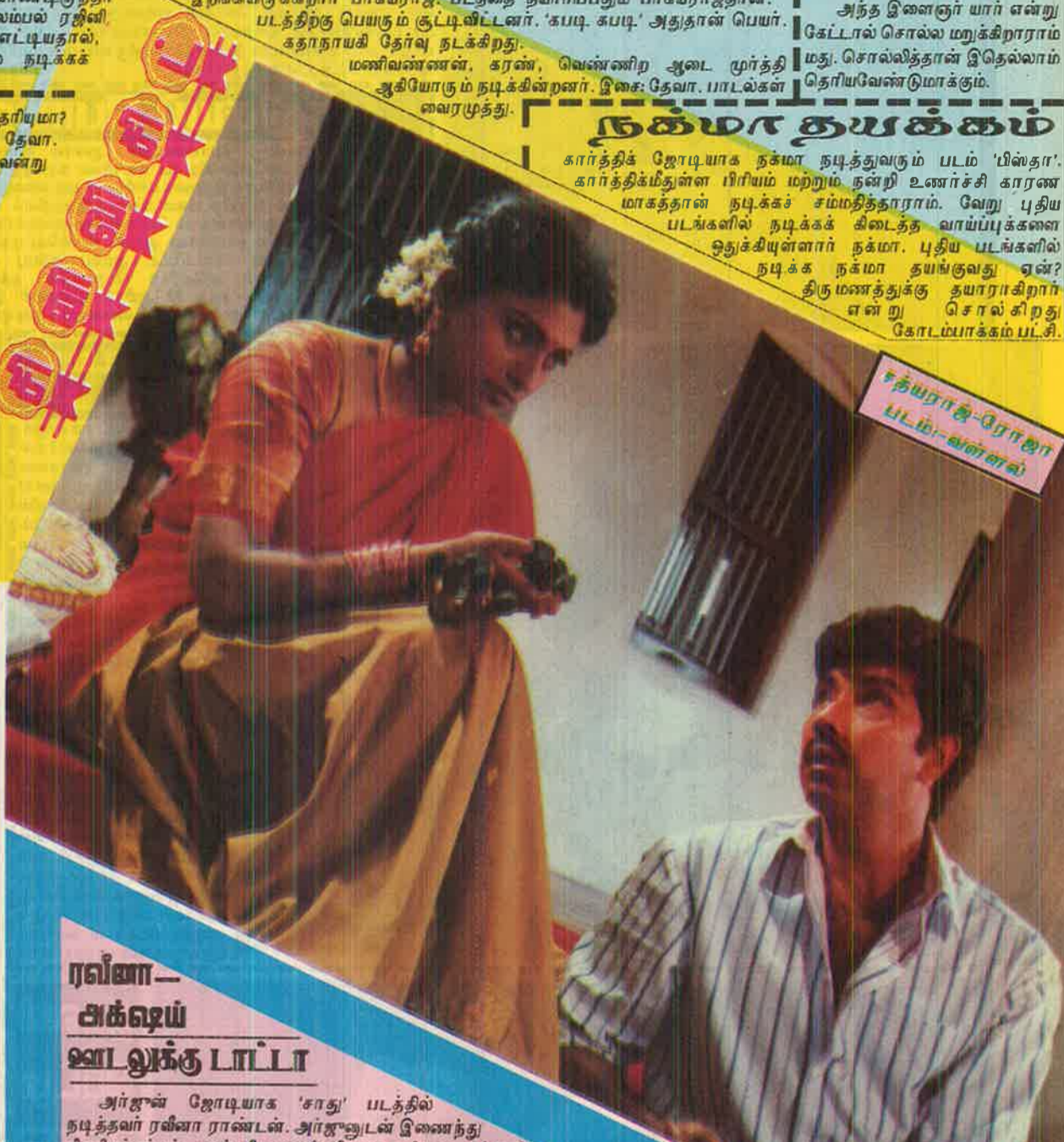
கருவியே உயிர்