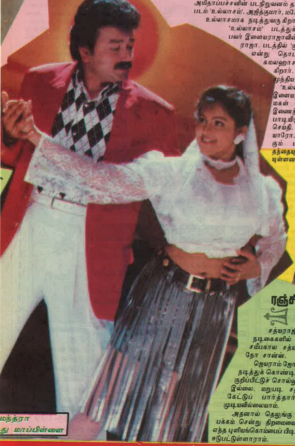
மந்திரா து மாப்பிள்ளை

'உல்லாசம்' படத்தில் இளையராஜாவும் அவரது மகள் பவதாரினியும் இணைந்து ஒரு பாடலை பாடியிருப்பது பிந்திய செய்தி. 'யாரோ யார் யாரோ...' என்று தொடங்கும் பாடலைத்தான் தந்தையும் மகளும் பாடியுள்ளனர்.