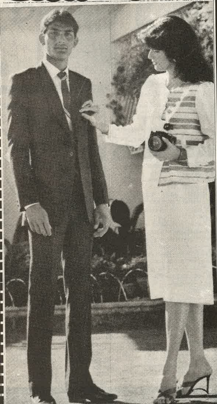
கொஞ்சம் கர்ந்து பார்த்தால் சட்டென்று தெரிந்துவிடும், இந்திய முன்னாள் கிரிக்கெட் கப்டன் அசாருத்தான். அருகில் நின்று அவர் சட்டையை சீர்செய்துவிடுபவர் சங்கீதா. (நேற்றுக் காலை இன்று மணவி)

இந்தப் படத்திற்கு ஒரு முக்கியத்துவம் இருக்கிறது. முதன் முதலாக சங்கீதாவும், அசாரும் சந்தித்துக்கொண்ட தினத்தில் எடுக்கப்பட்ட முதலாவது புகைப்படம் இதுதான். விளம்பரப் படமொன்றில் நடிக்கச் சென்ற போதுதான் சங்கீதாவைச் சந்தித்தார் அசார். அதற்குமுன்னரே அசாரின் பரம ரசிகையான சங்கீதா அசாரைப் பார்த்தவுடனேயே அவருடன் ஒட்டிக்கொண்டார். என்னவொரு சீர்செய்து விடுகிறார் என்று பாராட்டினார். இந்த வேகமும், நெருக்கமும் தான் அசாரை சங்கீதா மீது பைத்தியமாக்கிவிட்டதோ?