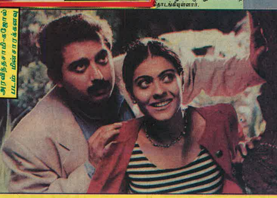
அரவிந்தசாமி-கஜோல் படம்: மின்சாரக்கனவு