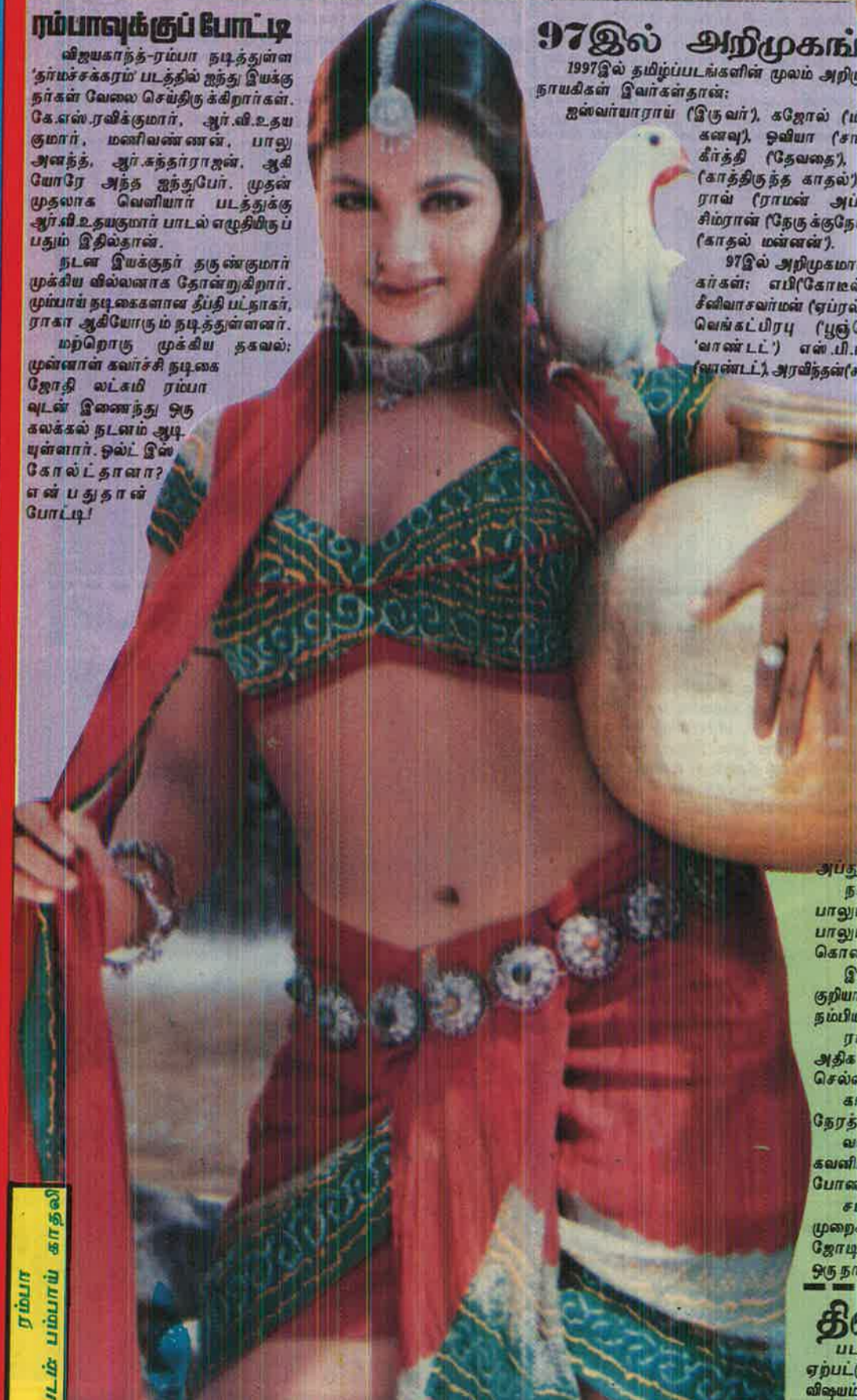
ரம்பா படம் மும்பாய் காதல்