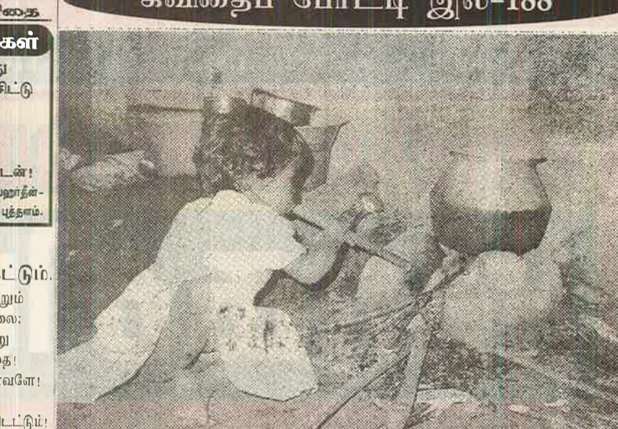
கவையியங்கள்! என்னத்தில் நோன்பும் கவிதைகளை வார்த்தைகளின் எண்ணிக்கை அதிகமில்லாமல், தூவாட்டையில் மட்டும் பதிவு செய்து அனுப்பியவர்கள். அனுப்பிய வேண்டிய கடைசித் திகதி:- 25.01.1997 முகவரி: கவிதைப் போட்டி இல.188 தினமுரசு வாரமலர், த.பெ. இல-1772, கொழும்பு.