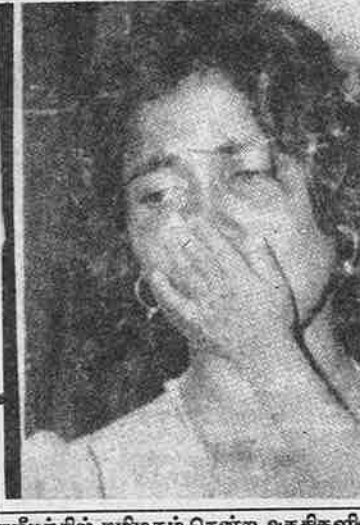
சமீபத்தில் தமிழகம் சென்ற அகதிகளில் ஒருவர். தாயைத் தேற்றும் சிறுவன்.

அதனால்தான் வீரவில காட்டில்-இவங்கை விவகாரத்தை முகாமில் அமெரிக்கா வழங்கும் பயிற்சி இரகசியமாக வைக்கப்பட்டிருந்தது. அது வெளியே தெரிந்தவுடன் வீதண்டலாவாத விவாக்கியா எங்கையுமே அமெரிக்கா கூறியிருந்தது. எனவே-இவங்கையில் அமெரிக்காவின் கரிசனை இந்தியாவுக்கு பிடிக்காத ஒன்றுதான். ஆனால், மறுபுறத்தில் புவிகளும் இந்தியாவின் நம்பிக்கைகொண்டு இந்துவிட்டதால் இந்தியா விடப்பட்டு தர்மச்சுடமாமிகிருக்கிறது.