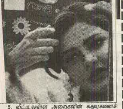
5. வீட்டிலுள்ள அறைகளின் கதவுகளைச் சாத்திவிட்டு, சென்டைக் காற்றில் நன்றாக ஸ்ப்ரே செய்து வேண்டும். பிறகு உடலை வளைத்துச் சுற்றினால் போதும். உடலும், துணிகளும் 'கமகம' வெண மாறும். வீட்டின் அறையும் வாசனையுடன் இருக்கும்.