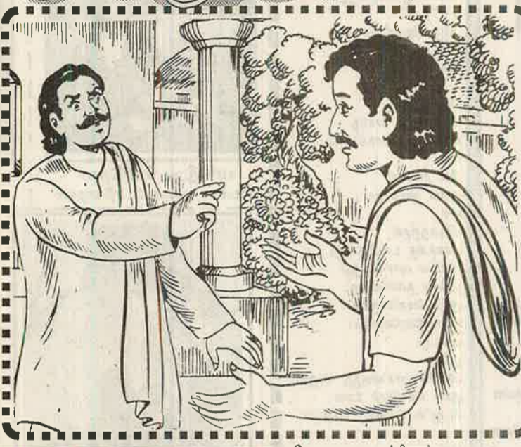
ஆலோசனை வழங்கினார். பெரியவர் சொல்வது சரியென்படவே இருவரையும் ஊர்ப்பெரியவர் விட்டிட்டு