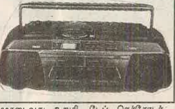
பழுதடையது உறுதி. டேப் ரெக்கோடர் பராமரிப்பு முறைகள் சிலவற்றைப் பார்ப்போம்.

* டேப் ரெக்கோடரை சுத்தப்படுத்துவதற்கு முன், மின்சார இணைப்பை நிறுத்திவிட்டு பின்னர் கழற்சியை பின்னரே சுத்தப்படுத்த வேண்டும். சுத்தப்படுத்த வெறும் ஈரத்தணி மட்டுமே போதுமானது. வேறு என்னென்ன களையோ, திரவங்களையோ அதுடன் நேரடியாக ஊற்றிச் சுத்தப்படுத்தக் கூடாது. ஹெட் பகுதியில் தூசியோ, அழுக்கோ சேராமல் பார்த்துக் கொள்ள வேண்டும். அதற்கு அதை அவ்வப்போது சிறிது பஞ்சை ஹெட் கிளினர் அல்லது ஓடிக்கொலோனில் நனைத்து, மிகவும் மென்மையாகத் துடைத்தெடுக்க வேண்டும். * எப்போதும் தரமான கசெட்டுக்களை மட்டுமே உபயோகிக்க வேண்டும். * மின்சாரத்திற்குப் பதிலாக பற்றியைப் பயன்படுத்தும்போது கீழ்க்கண்ட விஷயங்களை நினைவில் கொள்ள வேண்டும்.