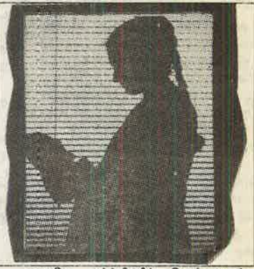
எனவே, கர்ப்பிணிப் பெண்ணுடன் வீட்டில் உள்ளவர்கள் அனைவரும் அன்பாக இருந்தாலும் கூட கணவன் கண்டிப்பாக அன்பு மனைவியிடம் குழந்தைப் பேறு பற்றிய பயத்தை விரட்டி அன்பு மழை பொழிய வேண்டும்.

முதன் முதலில் கருத்தரிக்கும் பெண்களுக்குப் பிரசவகாலம் நெருங்க நெருங்கப் பய உணர்வு அதிகமாகிக் கொண்டே இருக்கும். எனவே வீட்டிலுள்ள வயதான பெண்கள், கர்ப்பிணிப் பெண்ணிடம் பக்குவமாகப் பேசி அவளுடைய பயத்தைப் போக்க வேண்டும். கருவுற்ற பெண்ணிற்கு நல்ல இதமான சூழ்நிலையை ஏற்படுத்திக் கொடுப்பது வீட்டிலுள்ள பெரியவர்களின் முக்கியமான கடமையாகும். கணவனும் மனைவியுடன் அன்பாக இருப்பது மிக முக்கியமாகும். மனைவியை விட்டுப் பிரிந்து வெகு தொலைவில் கணவன் இருப்பதைக் கருத்தரித்த பெண்கள் விரும்ப மாட்டார்கள். அதிலும், முதல் பிரசவத்தின் போது கணவனின் அன்பு, பாசம் முழுவதையும் கர்ப்பிணிப் பெண் ஆவலுடன் எதிர்பார்ப்பது இயற்கையாகும்.