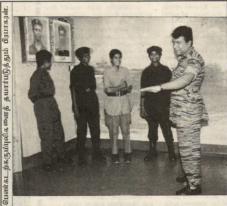
“யாரை யார் சுற்றி வளைப்பது?”

இலங்கையைப் பொறுத்தவரை பிரிட்டிஷ்காரர்களினாலேயே இப்பந்தயம் முதன் முதலாக அறிமுகப்படுத்தப்பட்டிருந்தது.