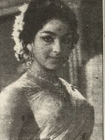
என்றும் யாக்கலாம் ஆனாலும், இந்தப் பட்டத்தில் உள்ள ஈர்ப்பு அவர்களிடம் இருக்கிறதா? சொல்லுங்கள்!!

தலைப்பற்றிவிடுவது புறப்படுகிறோம்-என்ற "தலைக்கணத்தில்" துறைக்கு வராத கருங்கொடிகள்! * பெண்களை வரைந்த கிறைவன் அடுக்க மறந்த தூரிக்கை. * மலர்ச்செண்டுகள் மட்டும் "மணச்சென்றி" வைத்து மாறி மாறி- காவல்காக்கும் "கொங்கோ" காடுகள்! * பாணகமுல்-எஸ்-முல்சாக்க, குருதாக்கல்.