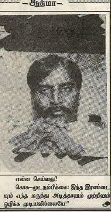
என்ன செய்வது? கொசு-மூடநம்பிக்கை இந்த இரண்டையும் எந்த மருந்து அடித்தாவும் முற்றிலும் ஒழிக்க முடியாமலேயே!

உடந்த வகுடம் சுவதேச சீத்யாக ஒரு கலக்குக் கலக்கிய சமர்சாரம்-பின்னையார் பால் குடித்தது. அதனைப் பற்றி கவிஞர் வைரமுத்து சொன்ன கருத்தொன்றை படிக்கக் கிடைத்தது. அது இதுதான்: "கூனசம்பந்தன் அழகான்; பாசதி வந்த பால் கொடுத்தான் என்ற கதைபோலவது ஒரு பெருள் பிள்ளை. ஒரு இயற்கை பால்லை என்ற பதறி அழகால் கடவுளின் மனைவி வந்து காப்பற்றுவார் என்ற பேலை நம்பிக்கையாவது அதில் பூத்திருந்தது. அந்நால், பின்னையார் பால் குடித்த கதை நேர் விடுவதால். தனது பால் மனிதர்களுக்கு உட்குடி வழங்கும் பதிலாக மனிதர்களை பால் கடவுள் பருகிற்றார் என்று கட்டிவிட்ட கதை கடவுள் மனிதன் செய்த தரோகம். அதைத்தான் பெரியார் திடலில் ஒரு மோடையில் பேசினார். இந்தியா போன்ற ஏழை நாட்டிற்கு பால் குடிக்கக்கூடிய பின்னையார் தேவை இல்லை. பால் கொடுக்கக்கூடிய பின்னையார்தான் தேவை."