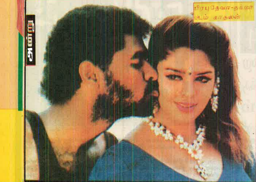
பிரபுதேவா-நக்மா படம் கர்துவன்

ஷர் என்று அவர் பெயர் ஆரம்பிக்கும். அந்த நடிகை கிச-கிசவில் சிக்காமல் இருப்பதற்காக கவனமாக இருக்கிறாராம். படப்பிடிப்பு இடைவேளையில் குழைந்து பேசும் நடிகைகளின் உத்திகளை எல்லாம் அவர் தவிர்த்து வருகிறாராம்.