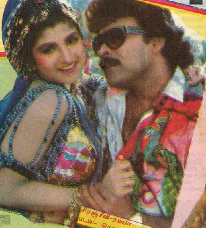
சிரஞ்சீவி-ரமயா படம்:- ரௌடி பாஸ்