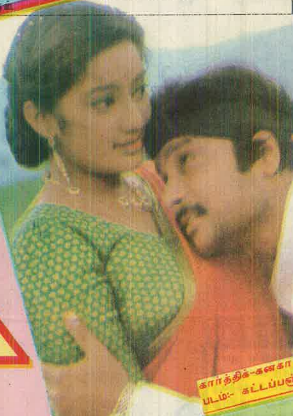
கார்த்திக்-கனகா படம்:- கட்டப்பஞ்சாயத்துக்காரன்

இந்திய பட நடிகைகள் தமிழ் படங்களில் தலை காட்டுவது (சுவையை மட்டும்) வர வர அதிகமாகிக் கொண்டே போகிறது. பிரசாந்த்துடன் ஜோடியாக நடிக்க கரிஷ்மா கபூர் இறக்குமதி செய்வது தொடர்பாக பேச்சுவார்த்தை நடக்கிறது. 'ஜோக்கர்' படத்தில் பிரசாந்த்தோடு நடிக்க கரிஷ்மா கபூரை அணுகியிருக்கிறார்கள். தமிழ்படவலருக்கு கரிஷ்மா வருவார் பின்னே! முரசு சினிவிசிட்டுக்கு வந்திருக்கிறார் முன்னே!