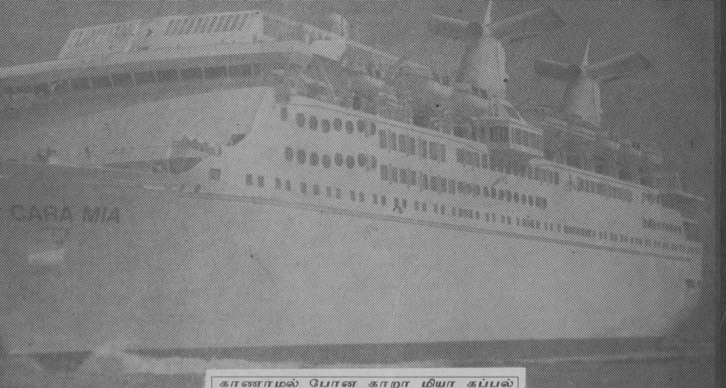
காணாமல் போன காறா மியா கப்பல்

கப்பல் இதுவரை கண்டுபிடிக்கப்படவில்லை. அமெரிக்க கடற்படை மற்றும் கரையோரக் காவல் படையினர் தேடுதல் வேட்டை நடத்துகின்றனர். எனினும் கப்பல் காணாமல் போன செய்தி மிக இரகசியமாக வைக்கப்பட்டுள்ளது. கிராண்ட் பஹாமா தீவின் துறைமுக நகரமான ஃபிற்போட்டில் தான் இக்கப்பல் கடைசியாகப் பதிவு செய்யப்பட்டுள்ளது. இங்கிருந்து புறப்பட்டுச் செல்லும் போது இது மாயமாக மறைந்துள்ளது. இக்கப்பலில் 1,530 பயணிகள்