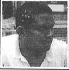
சேனன் Committee for Workers International - CWI

சுனாமி அலை ஓயாத அலையாக வறிய மக்கள் வயிற்றில் தொடர்ந்து அடித்துக் கொண்டிருக்கின்றது. உலக அரசாங்கங்கள் வாய் திறந்து கவலை தெரிவிக்கும் முன்னரே சாதாரண மக்கள் தமது அன்றாடத் தேவைகளை தியாகம் செய்து சுனாமியால் பாதிக்கப்பட்டவர்களுக்கு அள்ளிக் கொடுத்திருந்தார்கள். சுனாமி வந்து போன ஒரு கிழமைக்குள் Oxfam (Charity) செயாரிற்றி £160 மில்லியன் பவுண்டுகளை சேகரித்திருந்தது. CAFOD - Catholic Agencies for Overseas Development என்ற செயாரிற்றிக்கு 35,000 பேர் உடனடியாக பணம் வழங்கி இருந்தனர். Oxfam சேகரித்த £160 மில்லியனில் நமக்கு அதிகமான நன்கொடை பொது மக்களிடம் இருந்து மட்டுமே வந்தது குறிப்பிடத்தக்கது. இவ்வாறு ஓட்டுமொத்தமாக இங்கிலாந்தில் மட்டும் மக்கள் £300 மில்லியன் பவுண்டுகள் நன்கொடை வழங்கியிருந்தார்கள். உலகளவில் இலங்கைக்கு மட்டும் $2.95 பில்லியன் டொலர்கள் உதவித்தொகை வழங்க இருப்பதாக உறுதி அளிக்கப்பட்டிருந்தது.