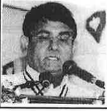
என் செல்வராஜா நூலகவியலாளர்