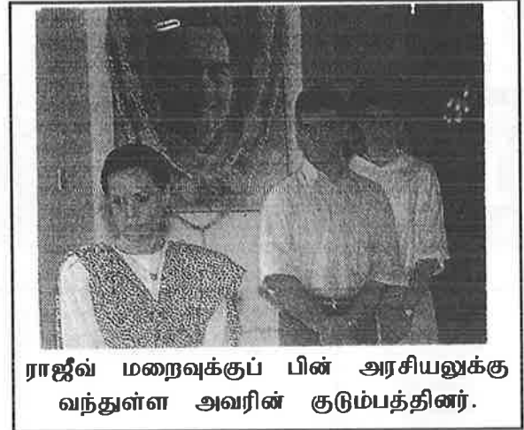
ராஜீவ் மறைவுக்குப் பின் அரசியலுக்கு வந்துள்ள அவரின் குடும்பத்தினர்.

இந்திய - இலங்கை புவியியல் நெருக்கம் காரணமாக இலங்கை அரசியலில் இந்தியாவின் தலையீடு தவிர்க்க முடியாத ஒன்றாகவே உள்ளது. மேலும் ஆரம்ப காலத்தில் தமிழீழ விடுதலை அமைப்புகள் இந்தியாவிடம் சரணாகதி அடைந்ததும், இந்தியாவை தாம் பயன்படுத்தலாம் எனத் தப்புக் கணக்கு போட்டதும், இலங்கை - இந்திய ஒப்பந்தமும், ராஜீவ்காந்தியின் படுகொலையும் இலங்கை அரசியலில் இந்தியாவும் ஒரு அங்கம் என்ற நிலையை ஏற்படுத்தியுள்ளது.