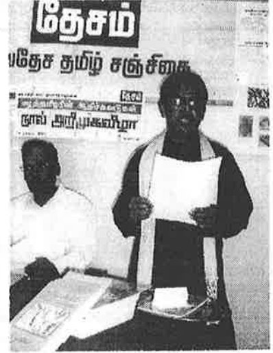
By Ramesh Pyron

I think this is because we in Britain spend most of our time watching television and playing Playstation games.