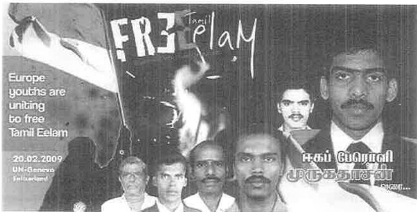
இனமொழி உணர்வுடன் தீக்குளித்தவர்கள்

நடைமுறைப்படுத்துவதற்குமான தனிச் சிறப்புமிக்க அதிகாரத்தைத் தன்னகத்தே வரித்துக் கொண்டிருக்கும் ஐக்கிய நாடுகள் சபையே, உன் இருண்ட கண்களைத் திறந்து பார், வன்னித் தமிழனை என்று கேட்டு உடனடிப் போர் நிறுத்தத்தையும் சிங்கள அரசின் கொலைகளையும் சுட்டிக் காட்டி நின்றோம். நீங்கள் இப்படியே கேட்டு அப்படியே விட்டுவிடுகிறீர்கள். நாங்கள் மனித உரிமையின் மையம் கொண்ட ஊர்வலங்களையும் போராட்டங்களையும் நடத்தி வருகின்றோம். நீதி கிடைக்கும் வரையில் நாம் ஓயமாட்டோம்!