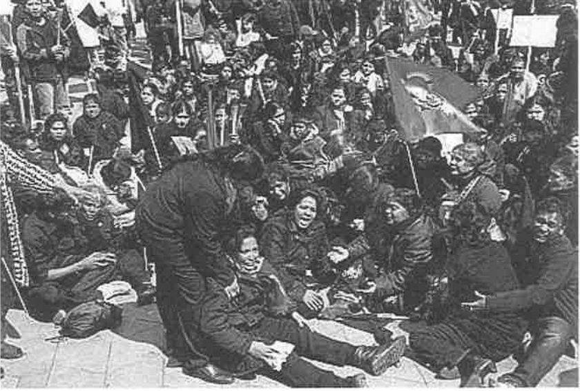
தமிழினப் படுகொலையை நிறுத்தும்படி வீதியில் கிடந்து புலம்புகின்றனர்