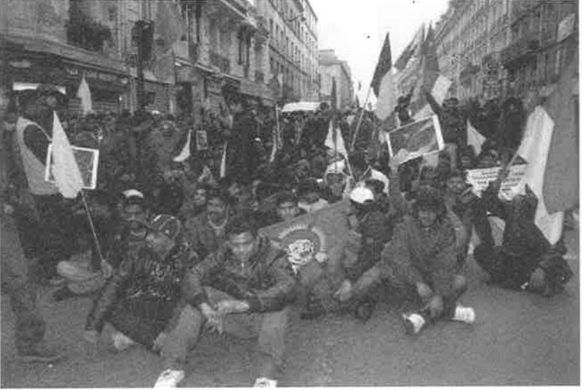
வன்னி படுகொலையைக் கண்டித்து போராட்டம்.