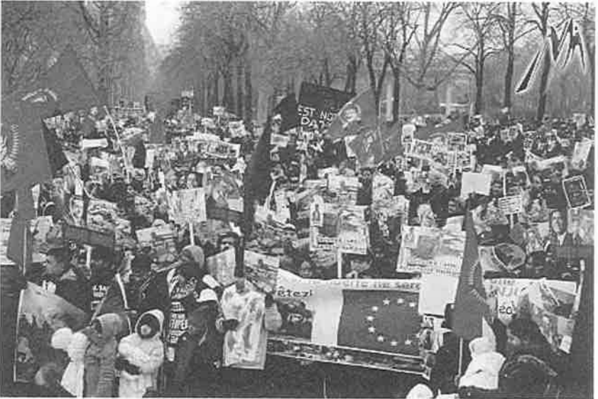
உறவுகளுக்காகக் கொடியேந்திப் போரிடும் சந்ததியினர் - இராணுவப் பாடசாலை முன்