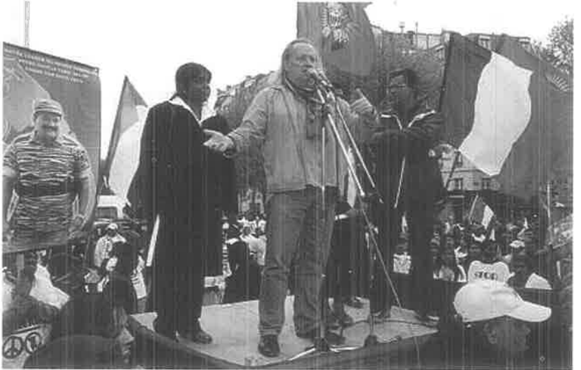
லாகோர்னோவ் நகர்ப்பிதா உரையாற்றுகிறார்