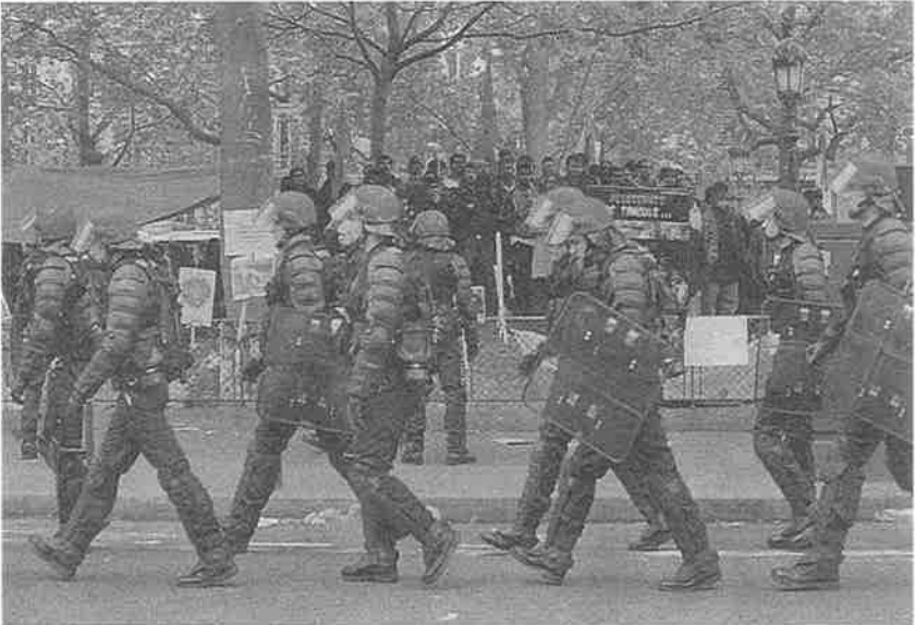
அதிரடிப் படையினரால் போராட்ட இடம் அனுமதி மறுக்கப்பட்டுக் கலைக்கப்படும் காட்சி