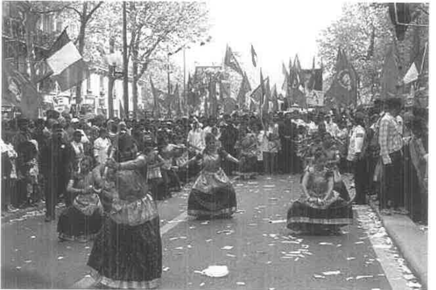
மேதின ஊர்வலத்தில் தமிழரின் கலைக்கோலம்