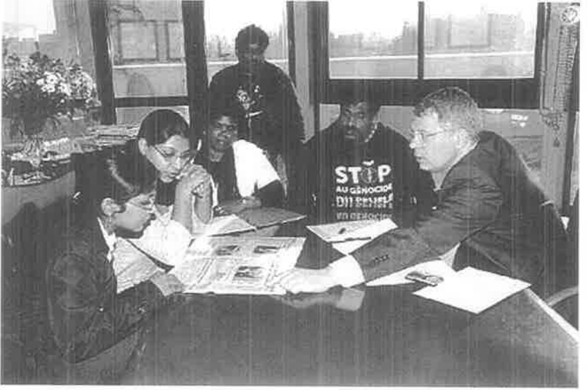
தமிழீழத்தில் பிஞ்சுக் குழந்தைகள் கொல்லப்படுவதை விளக்குகின்றனர்.