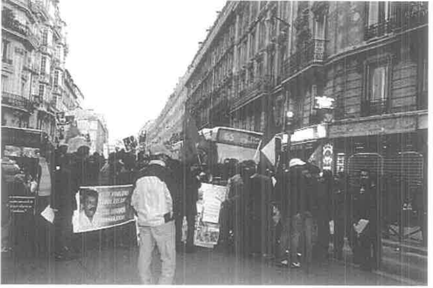
மனித உரிமை மீறல் நடக்கிறது, அதைத் தடுத்து நிறுத்துவதற்கு உலக நாடுகளுக்கு உரிமை உண்டு. (லாச்சப்பல்)