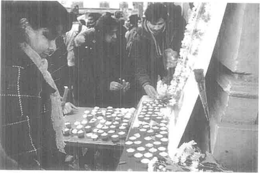
இனவிடுதலை வேண்டிக் கடவுளைப் பணிதல்