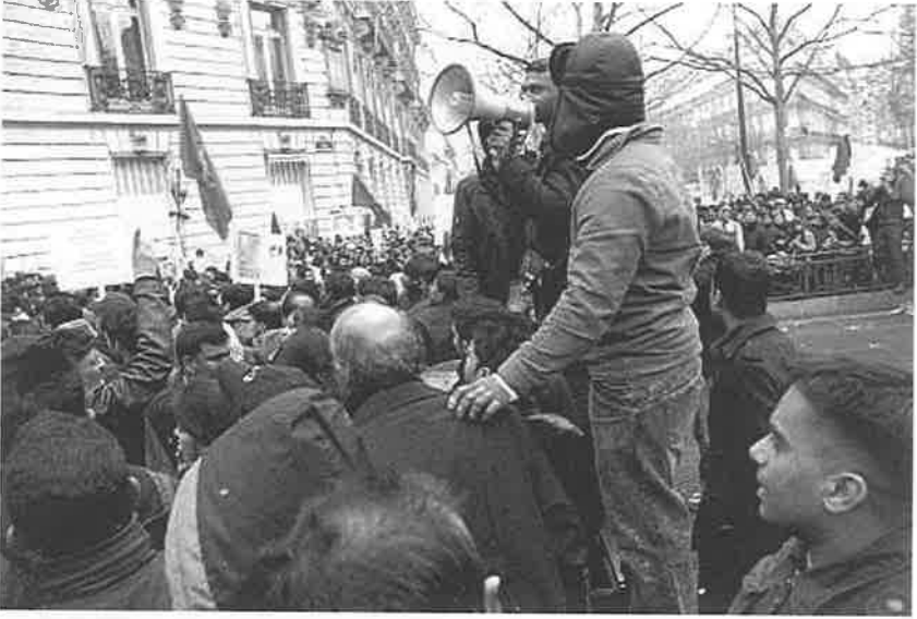
ஊர்வதேசத்தின் முன் நீதிவேண்டி நிற்கும் தலைமுறை