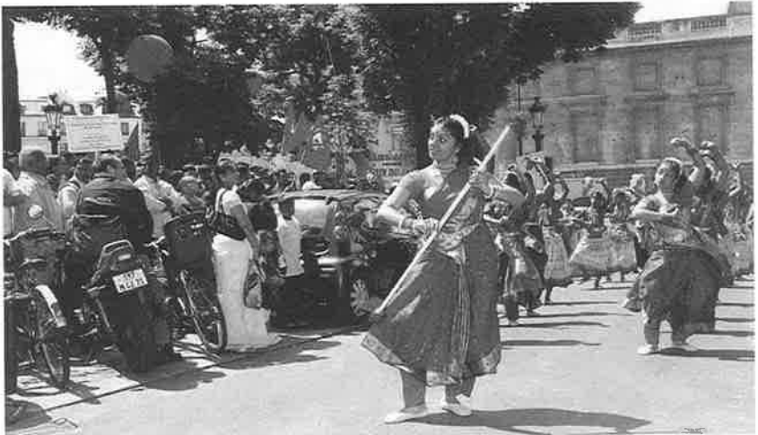
பிரான்ஸ் தமிழர் தங்களுடைய ஒட்டுமொத்த உணர்வையும் வெளிப்படுத்திய ஊர்வலம்