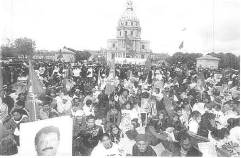
நீதி வேண்டி இரவுபகலாய் இருக்கும் காட்சி