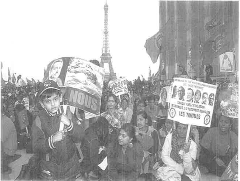
வாக்குறுதியை நம்பி நிமிர்ந்து நிற்கும் கோபுரம்போல் தமிழர்கள்