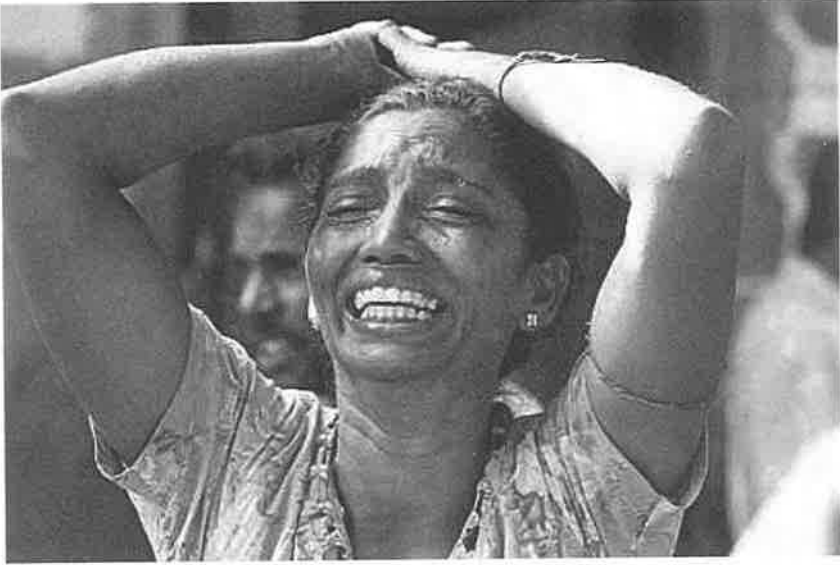
போர் அல்ல கொடுமையான மனிதஉரிமை மீறல்கள் அங்கே நடக்கின்றன. இத்தாயின் கண்ணீரைப் பார்த்தாயினும் தெரிந்து கொள்ளுங்கள்