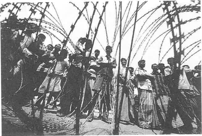
முட்கம்பிச் சிறைக்குள் மூன்று லட்சம் தமிழர்கள்