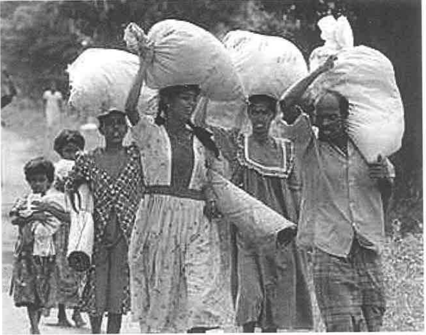
இடப்பெயர்வு என்பது கொடுமானது என்பதை 1995 ஒக்டோபர் 30 யாழ் மக்கள் இடப்பெயர்வு நிரூபித்தது.