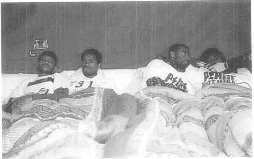
உறவுகளைக் காக்க உண்ணா நோன்பிடுக்கும் நாங்கு இளைஞர்கள்