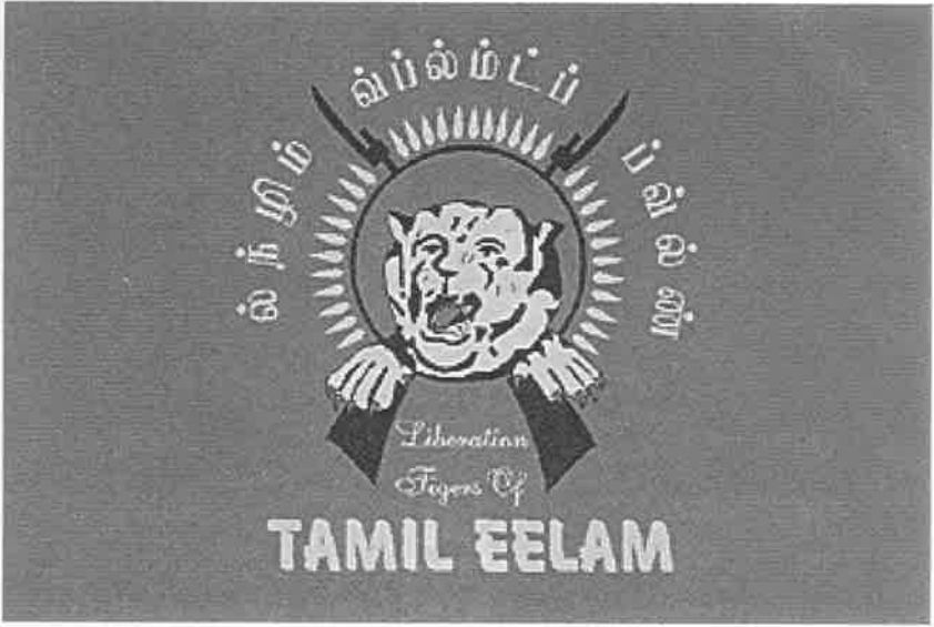
தமிழர் வரலாற்றின் சிறப்பு மிக்க தேசியக்கொடி