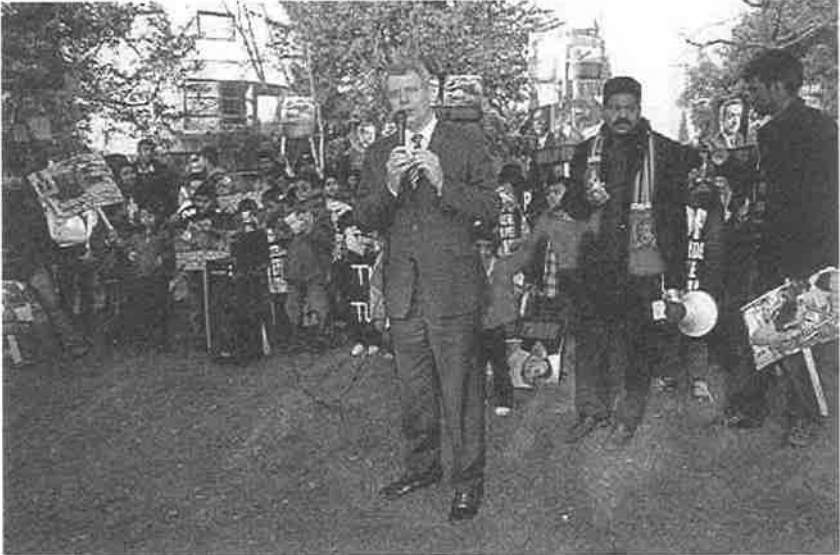
தமிழீழ மக்களைப் பாதுகாப்பதற்கான செயற்பாட்டில்