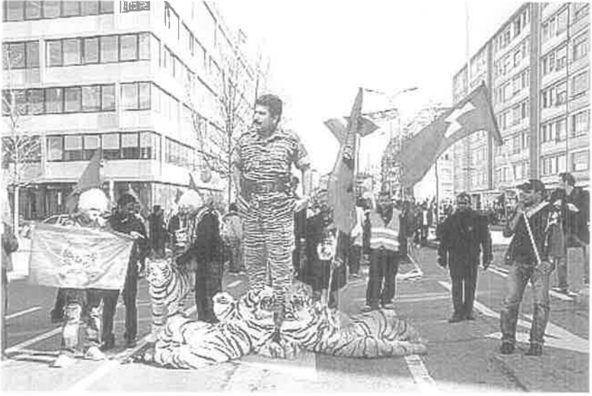
தலைவனின் ஆணை கிடைக்கும் தலைமுறை வாழ்வு செழிக்கும்