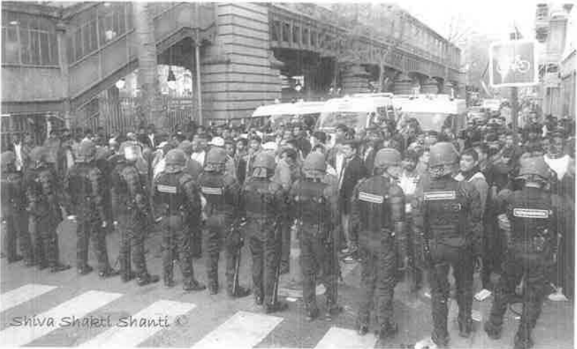
வன்னி படுகொலை கண்டு