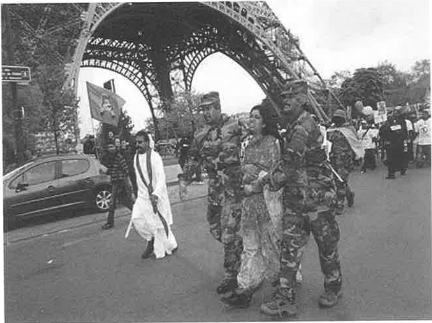
சிறிலங்கா பயங்கரவாதத்தின் காட்சிப்படுத்தல் வீதி நாடகம்