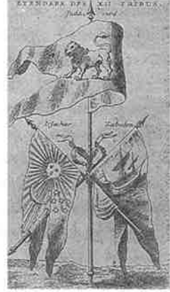
பழைய ஏற்பாட்டில் இடம் பெற்ற முதற்கொடிகள்

பறந்த கம்பீரமிக்கவையென வரலாறு புகட்டும். ஈழத்திலும் தமிழன் கொடியோடும் படையோடும் முடியோடும் ஆண்டபோது கொடியின் சிறப்பு வீரியமானது. பண்டைய வரலாறும் பண்டைய ஆய்வுகளும் பண்டையத் தமிழகத்தோடு பின்னிப் பிணைந்து கிடக்கின்றன. இந்த உண்மையோடு 'நந்திக்கொடி' யாழ்ப்பாணத்து மன்னர்கள் காளை உருவத்தையே நாணயங்களில் மட்டுமன்றி அரச கொடிகளிலும் ஆவணங்களிலும் அரச இலச்சினை யாகப் பயன்படுத்தியுள்ளனர். அத்துடன் இக்கால மன்னர்களிலும் ஒருவனை தட்சிண கைலாச புராணம் 'இடபவான் கொடி எழுதிய பெருமான்' எனவும் வர்ணிக்கிறது. சிவ வழிபாட்டின் முக்கியத் துவத்தை எடுத்துக்காட்டும் சின்னங்களுள் சிவனின் வாகனமான நந்தி(காளை) சிறப்பாகக் குறிப்பிடத்தக்கது. சிந்துவெளி நாகரிகக் கால முத்திரைகள் பலவற்றில் இவ்வருவம் பொறிக்கப்பட்டிருப்பதைச் சான்றாகக் காட்டியுள்ளனர். சங்ககால மூவேந்தர் வெளியிட்ட நாணயங்கள் பலவற்றில் நந்தி முக்கியச் சின்னமாக இடம்பெற்றுள்ளது. இந்த வகையில் கி.மு. 3ஆம் நூற்றாண்டிலிருந்து நாணயங்களை வெளியிட்டு வந்ததற்கும் அவற்றில் நந்தியைப் பொறித்ததற்கும் உறுதியான சான்றுகள் உள்ளன.