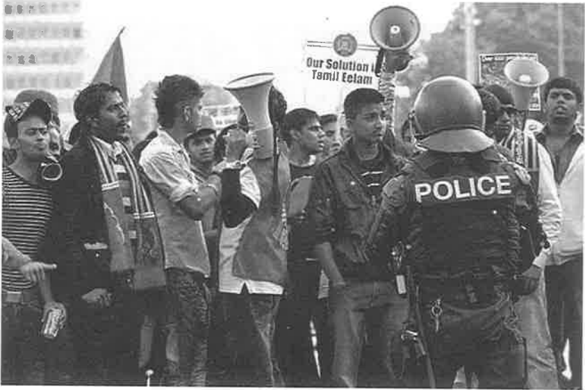
போராடுவோம் போராடுவோம் நீதி கிடைக்கும்வரை போராடுவோம்