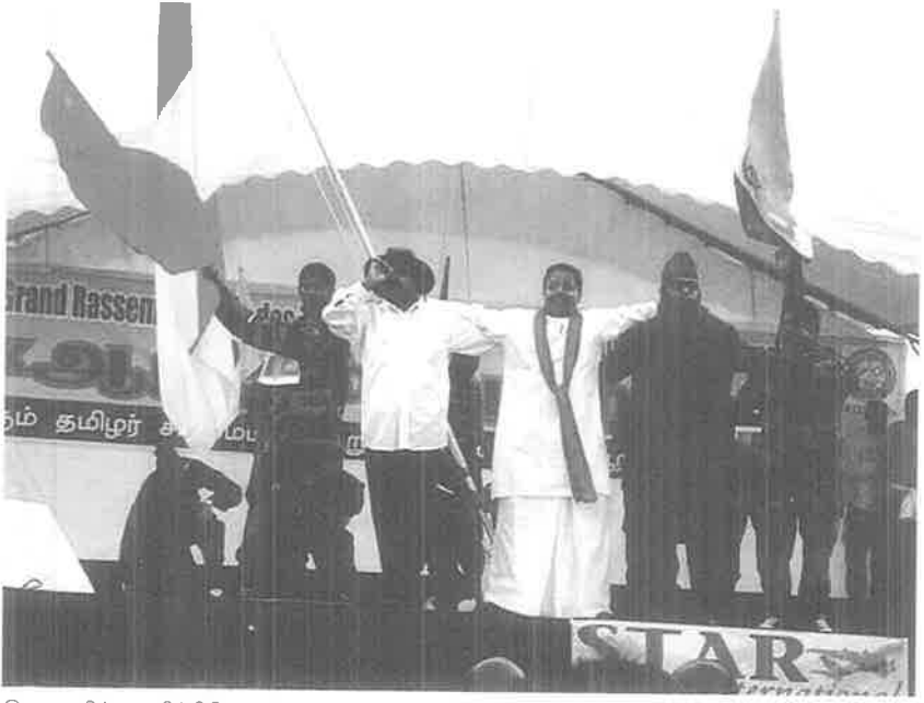
இன அழிப்பை சித்திரிக்கும் கலைப்படைப்பு