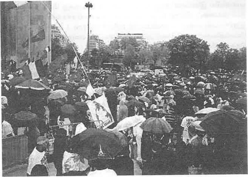
கொட்டும் மழையிலும் உறுதியோடு நிற்கும் உள்ளங்கள் - அன்வலிட்

தினம், தமிழர்களுக்கு சுதந்திரம் இழந்ததினம் 'கரிநாள்'. பிரான்சில் தமிழர்கள் வாழும் இடங்கள், தமிழரின் கடைத்தெருக்கள் கறுப்பாகிய அன்றைய தினம் கார்கூன் நோட் முதல் லாச்சப்பல் எங்கும் வெறிச்சோடிக் கிடந்தது. அதே தினம் பிரான்ஸ் நாடாளுமன்றத்தில் சில நாடாளுமன்ற உறுப்பினர்களுடன் சந்திப்பும் நடந்துகொண்டிருந்தது. ஈபில் கோபுரத்தின் அருகில் உள்ள சமாதான சுவர் மைதானத்தில் 'கரிநாள்' மாபெரும் எழுச்சிக் கூட்டமாக நடைபெற்றது. அன்றும் மக்கள் உணர்ச்சியுடன் கூடி நின்றார்கள். பிரான்சில் எப்போதும் இல்லாதவாறு மக்கள் தேசியக் கொடியுடன் தமது தேசியத்தை வழிமொழிந்து நின்றார்கள். எமது இளைஞர்கள் மக்களை எழுச்சி அடையச் செய்துகொண்டிருந்தார்கள். பத்திரிகையாளர்கள் தொலைக்காட்சியினர் என ஊடகங்கள் எமக்கிடையே கருத்துகளைக் கேட்டுத் தெரிந்துகொண்டார்கள். நாடாளுமன்ற உறுப்பினர், மேயர், அனுதாபிகள் என்று பல இனமக்கள் தமிழரின் போராட்டத்தை ஆதரித்துப் பேசினார்கள். முப்பதாயிரத்திற்கும் மேற்பட்ட ஒரே இனத்தைச் சேர்ந்த மக்கள் கூடி நிற்பதை இந்த நாடு பார்த்துக்கொண்டிருந்தது! எங்களுக்கு உலகத்தைப் பார்ப்பது போன்ற பிரமிப்பு! எங்கள் தாயகத்தில் கொலைகள் நிற்கவில்லை. எமது மக்களின் எழுச்சியைத் தொடர்ந்து பாரிஸ் மைய இடங்களில் தமிழர் வர்த்தகங்கள் நிறைந்த இடமான சின்ன யாழ்ப்பாணம் என்று அழைக்கப்படும் லாச்சப்பல் அன்று சூடுபிடித்தது. ஏப்ரல் 06, 2009