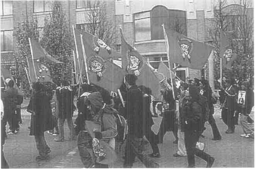
தாயக உறவுகளைக் காப்பதற்காக ஓடுகின்றனர்