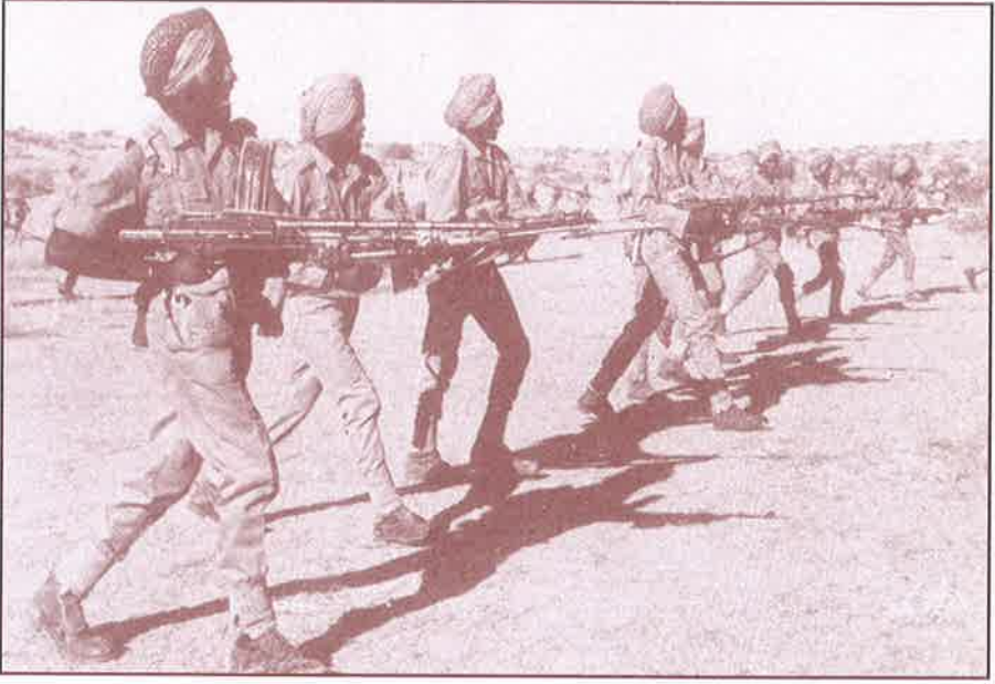
வங்க மக்களைக் காக்க விரையும் இந்தியப் படை