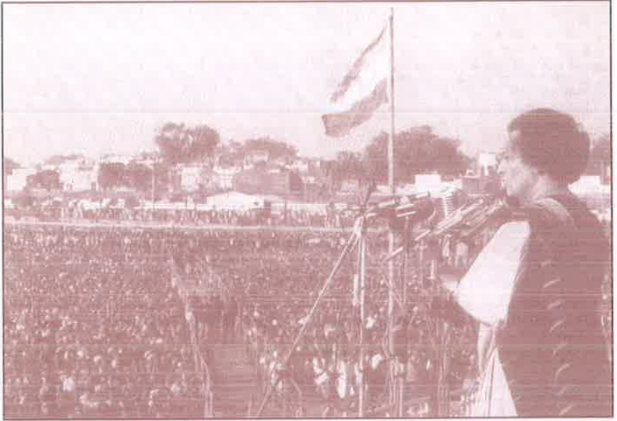
வங்காளிகளுக்காகக் குரல் கொடுக்கும் இந்திரா