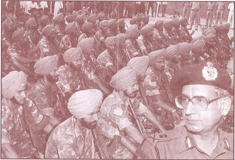
தமிழர்களை ஒடுக்க விரையும் இந்தியப் படை