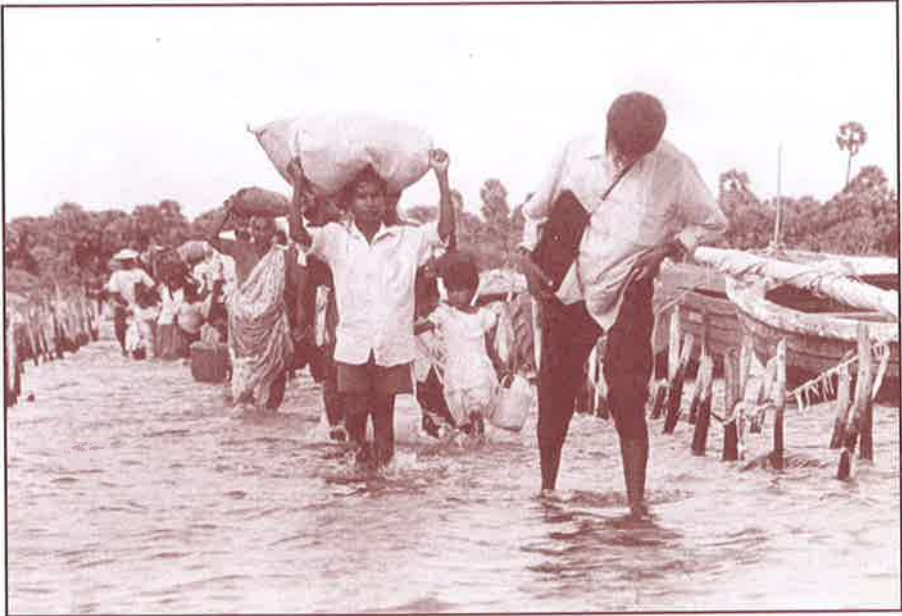
கடல் தாண்டிவரும் தமிழ் அகதிகள்