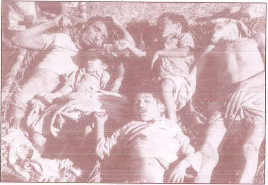
பாகிஸ்தான் படை வெறிக்குப் பலியான வங்காளிகள்