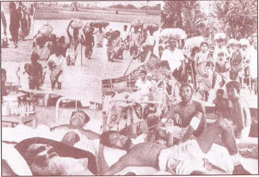
நதியைத் தாண்டிவரும் வங்க அகதிகள்