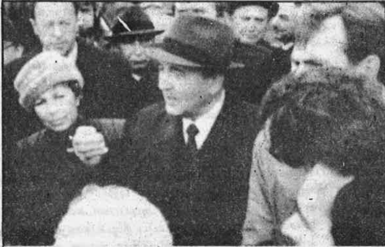
கோர்ப்பசேவ்: அதிகாரவர்க்க முதலாளித்துவத்தின் அவதாரம்.

பாட்டாளி வர்க்க சர்வாதிகார ஆட்சியை உள்ளிருந்தே சிதைத்து, அதிகாரத்தைக் கைப்பற்றிய முதலாளித்துவப் பாதையாளர்கள், முப்பது ஆண்டுகளாக அதிகார வர்க்க முதலாளித்துவ அமைப்பை நிறுவி ஆண்டு வந்தனர். அந்த நாடுகளில் பல்வேறு காரணங்களால் அந்த அதிகார வர்க்க முதலாளித்துவம் நீடித்திருந்தாலும் (சோவியத் ஒன்றியம் மற்றும் கிழக்கு ஐரோப்பிய நாடுகளில் 30 ஆண்டுகளாகவும், இன்னும் சீனா, வியத்நாம், கியூபா போன்ற நாடுகளில் 15 முதல் 20 ஆண்டுகளாகவும்) அதையே கூட அவை தக்க வைத்துக் கொள்வது அவ்வளவு எளிதானதாக இல்லை. மாசேதுங் சொன்னதைப் போல் வாய் கொள்ளாத அளவு பெரிய துண்டைக் கடித்துக் கொண்டு மெல்லவும் முடியாமல் விழுங்கவும் முடியாமல் விக்கித் திணறிப் போனார்கள்.