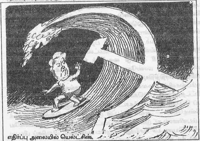
எதிர்ப்பு அலையில் யெலட்சின்.

“ஜனநாயக மயம்” என்ற ருசியப் பத்திரிக்கை, “அமைப்பு ரீதியில் திரண்டுள்ள குற்றக் கும்பல்கள்” என்கிற தனது சிறப்பிதழில் பின்வருமாறு எழுதியுள்ளது: “சமுதாயத்தின் அரசியல், சமூக வளர்ச்சியில் அமைப்பு ரீதியில் திரண்ட குற்றக் கும்பல்களால் பாரிய பாதிப்புகள் ஏற்படுகின்றன. தனியார்மய மாக்கலுக்கும் அந்தக் குற்றக் கும்பல்களுக்கும் ஒரு நெருக்கமான பிணைப்பு இருக்கிறது. புதிதாக உருவாகும் மூலதனம் மற்றும் வங்கித் தொழில்கள் கிரிமினல் மயமாவது, உதயமாகும் முதலாளித்துவத்துக்கும் தொழிலாளர் உரிமைக்கும் பெரும் அச்சுறுத்தலாக இருக்கிறது. அடுத்தடுத்து ஆட்சிக்கு வருபவர்களுக்கு அமைப்பு ரீதியில் திரண்ட இந்தக் குற்றக் கும்பல்கள் இராணுவம் மற்றும் பாதுகாப்பு விவகாரங்களில் பாதிப்பு ஏற்படுத்துவதாக உள்ளன. அவை சட்ட மரபுகள் மற்றும் குடிமக்களின் மனித உரிமைகளையும் பாதிக்கின்றன. சர்வதேச ரீதியிலும் இவை பாதிப்பு ஏற்படுத்துகின்றன.”