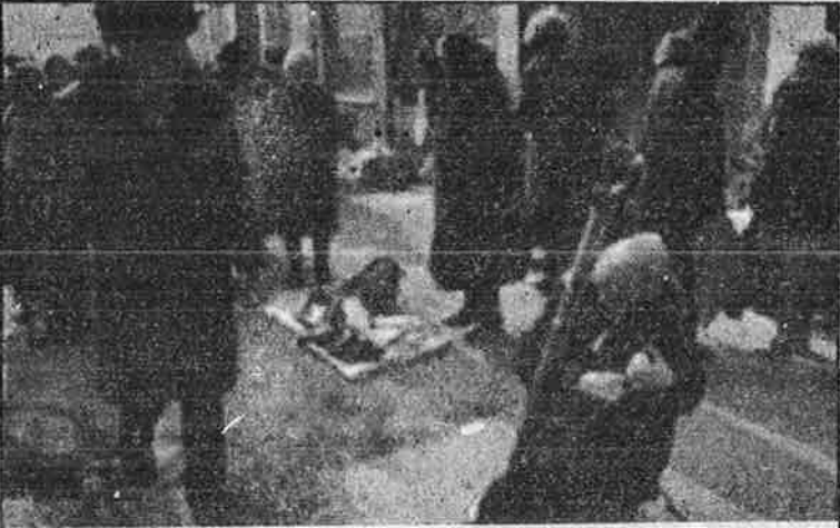
சோசலிசம் பழங்கதையாச்சு, வாழ்க்கை பழங்குப்பையாச்சு.

சந்தைப் பொருளாதார முறை என்பது தனியுடமை அதாவது தனியார் மூலதனம் - முதலீடு அடிப்படையிலானது. ஆனால் "நேற்று வரை" தொழில்களும் நிலமும் அரசு ஏகபோக உடமையாக இருந்த பொருளாதார அமைப்பில் திடீரென்று தனிவுடமையும் தனியார் மூலதன முதலீடும் எப்படி வந்தது? வரலாற்றில் முதலாளித்துவப் பொருளாதார அமைப்பு உருக் கொண்ட போது நிகழ்ந்த "மூலதனத்தின் ஆதிமுதல் திரட்சி" பற்றிய உண்மையை முதலாளித்துவப் பொருளாதார வல்லுநர்கள் மூடி மறைக்க முயன்றதைப் போலவே முன்னாள் சோசலிச நாடுகளில் தனிவுடமையும் தனியார் முதலீட்டிற்கான "மூலதனத் திரட்சியும்" எப்படி, எப்போது நிகழ்ந்தது என்பதைப் பற்றி வாய் திறவாமல் இருக்கின்றனர். "கம்யூனிசம் தோற்றுவிட்டது! முதலாளித்துவம் வென்றுவிட்டது" என்று அவர்கள் எக்காளமிடுவது உண்மையல்ல என்பதை இந்தக் கேள்விக்கான பதில் நிரூபிக்கிறது. அதற்கு மாறாக, கம்யூனிசம் ஒரு பின்னடைவைச் சந்தித்திருக்கும் அதே சமயம் - அந்தப் பின்னடைவும் இப்போது வந்ததல்ல; அறுபதுகளின் ஆரம்பத்தில் போலிக் கம்யூனிஸ்டுகள் ஆட்சியைப் பிடித்த போது நிகழ்ந்தது தான் - முதலாளித்துவ ஏகாதிபத்தியம் மேலும் சிக்கலான ஒரு நெருக்கடிக்குள் புகுந்துள் ளதுதான் உண்மையாகும்.