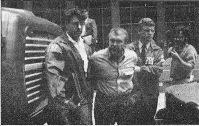
மாஃபியா: மறுசீரமைப்பின் விளைச்சல்.

இப்போது பெருமையுடன் பத்திரிகைக்குப் போட்டி கொடுக்கிறான், மாவ்ரோடி.