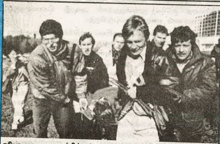
ரசியா: ஜனநாயக காற்றில் தப்பவில்லை தலைகள்.