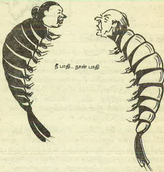
நீ பாதி.. நான் பாதி

லாம் நஞ்சாகிப் போகுமே, குடிக்கவும் தண்ணீர் கிடைக்காமல் போகுமே என்றெல்லாம் யார் எடுத்துச் சொன்னாலும் எதையும் அரசும், இறால்பண்ணை முதலாளிகளும் காதில் வாங்கிக் கொள்வதாக இல்லை. உடனுக்குடன் கைத் கெட்டும் பணம் அவர்களின் கண்களை மறைக்கிறது. கேட்டாலும் திமிராக சொல்கிறார்கள். "நிலமாவது, நீராவது, இறால் வளர்ப்பில் விளைவதெல்லாம் பணம்", "நெற்பயிர் யாருக்கு வேண்டும்? இறால் மீன் பணப்பயிர்" என்கிறார்கள்.