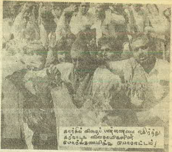
தாய்லாந்தில் பள்ளிகளில் உழைத்து கொண்டுவந்தவர்கள் பண்ணைமுதலாளிகளிடம்!

எல்லா கொடுங்கோன்மை சக்திகளுக்கு எதிரான போராட்டமாக வளர்க்க வேண்டும். பிற மக்கள் போராட்டங்களோடு ஒன்றிணைக்க வேண்டும். உழைக்கும் விவசாயப் பெருங்குடி மக்கள் நமக்குள் ஊறிப்போயிருக்கும் தேவையில்லாத சாதி, மத வேறுபாடுகளை ஒதுக்கித்தள்ளி ஒன்றிணைந்து நின்றால் எந்தச் சக்தியாலும் நம்மை நம் மண்ணிலிருந்து அகற்றி விட முடியாது நமது போராட்டத்தை முறியடிக்க முடியாது.