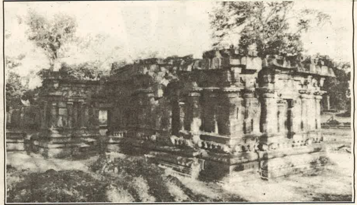
முதலாவது சிவாயம் - பொலநறுவை

க்கு உட்பட்டதாக இருந்ததாகக் குறிப்பிடுகின்றன. அதே நேரம் பராந்தகனை வெற்றி கொண்ட கிருட்டிணன் இராஜமேஸ்வரத்திற்கு வந்து தனது வெற்றிக் கொடியை நாட்டிய பின் நாகதிபத்திற்கு (நயினா தீவு) வந்ததாக குள வம்சம் சொல்கின்றது.