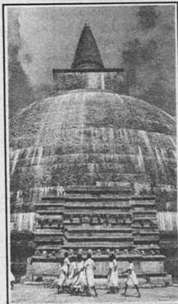
தேவநம்பியதீசன் காலத்து விகாரை

தப் பிரிவினர், வட இந்தியாவிலுள்ள அசோகனது மௌரியத் தலை நகருடன் தொடர்பு கொண்டு தங்களை ஆரியச் சார்பாளர்களாக காட்டிக்கொ