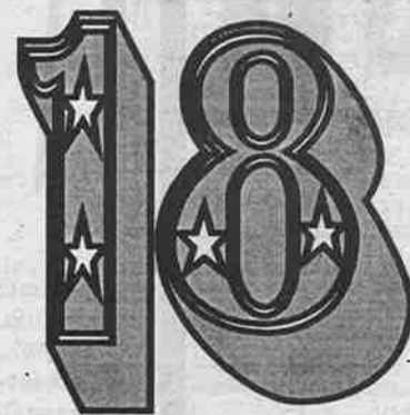
சிங்கைப் பரராசசேகரன் கனகசூரிய சிங்கையாரியன்

செண்பகப் பெருமான் கரும் போர் நிகழ்த்திய நாட்களில் அரண்களும் இராசதானியும் பெரிதும் அழிவுற அவற்றைச் செண்பகப் பெருமான் திருத்தியமைத்தானென்றே கொள்ளவேண்டும். சுப்புமல்குமரபா யாழ்ப்பாணப் பட்டினத்தில் கோட்டைகளையும் காவலரண்களையும் அமைத்தான் என்று ராஜவலிய சொல்வனவும் இக்கருத்துக்கு ஆதாரமாகவுள்ளன. ஆரியச் சக்கரவர்த்திகளின் பழைய தலைநகரமாக விளங்கிய யாழ்ப்பாண நகரி பாழாகி விட்டமையினால் இவன் நல்லூரைத் தலைநகராக்கிக் கொண்டான். உண்மையில் பதினாறாம் நூற்றாண்டிலேயே நல்லூர் தலைநகரமாக மாறியது. யாழ்ப்பாணத்தை வென்ற புகழ் சிங்களநாடெங்கும் பரவிப் பேராணத்தத்தை விளைவித்து இவ்வெற்றியை புகழ்ந்த கோகில சந்தேசவெனும் குயில் விடு தூதைப் பாடிய சிங்களப் புலவர் ஒருவர் சுப்புமல் குமரபாவை 'ஆரிய வேட்டிடயாடும்