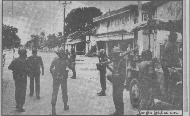
யாழ்ப்பில் இந்தியப் படை