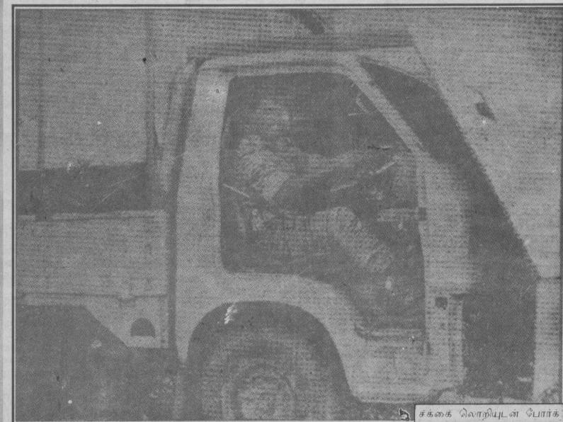
சக்கை வெறியுடன் போர்க்.

பென் புலிகள் உட்பட 40 பேர் பலியானார். மாங்குளம் சண்டையிலும் புலிகளின் பெண்கள் படையினர் முக்கிய பங்கு வகித்திருந்தது.