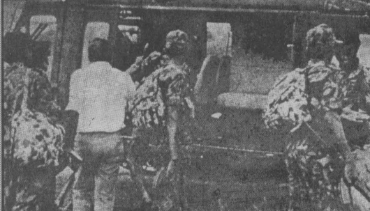
பேச்சுவார்த்தைக்காக வவுனியாவிலிருந்து கொழும்புக்கு

அரசியல் திவுக்கு டீக்மி தேய்தல் கட்சி ஒத்தமைக்க வேண்டும் என்றும், புலிகளுடன் பேசுவதாயின் எதிர்க்கட்சி ஒத்தமைக்க வேண்டும் என்றும் தற்போது பொதுஜன முன்னணிவினர் கூறி வருகின்றனர். அவ்வாறு பொதுஜன முன்னணியில் பிரதானமாக இருப்பது சிறிதளவு கத்திரிக்