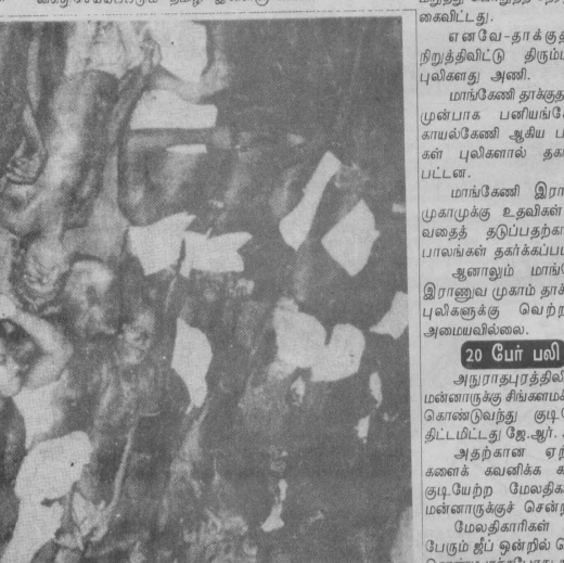
மண்டைதீவில் பலியான மீனவர்கள்