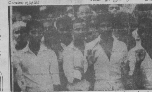
புசா முகாமில் தடுத்து வைக்கப்பட்டவர்கள்

கண்டனம் புலிகளின் நடவடிக்கையைக் கண்டித்து பத்திரிகை அறிக்கை, துண்டுப் பிரசகரம் என்பவற்றை வெளியிட்டது ஈ.பி.ஆர்.எல்.எம்.பி. பிரசுரத்தில் தெரிவிக்கப்பட்டிருந்தது இதுதான்: "ஒரு புறத்தில் எதிரியிடம் இருந்து மக்களைப்பாதுகாக்க பதங்கு குழினை வேட்டுப்படி அறைகலிக்கொண்டு, மறுபுறத் தில் போராளிகளுக்குப் புகை குழிகள் தொண்டுவது எனக்கே காட்டுகின்றது? "தந்தையலாக", "தவறுதலாக"... "தெரியாமல்" இப்படியான காரணங்கள் எவையுமே ஏற்கக்கூடியவை அல்ல.