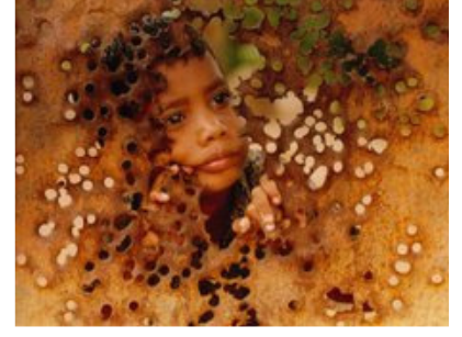
எனது பதிவுகள் 4