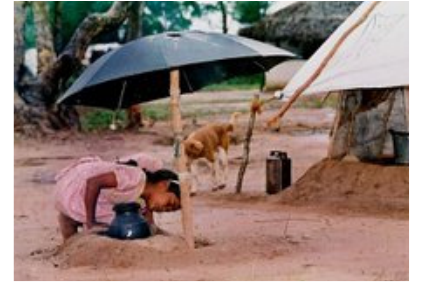
எனது பதிவுகள் 5