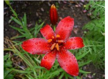
எனது பதிவுகள் 1