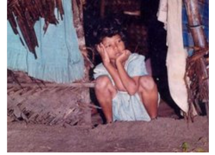
எனது பதிவுகள் 2