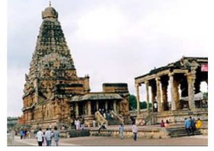
எனது பதிவுகள் 8