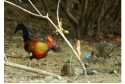
எனது பதிவுகள் 6