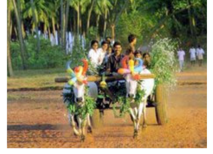
எனது பதிவுகள் 9

Inscription à : Publier les commentaires (Atom)