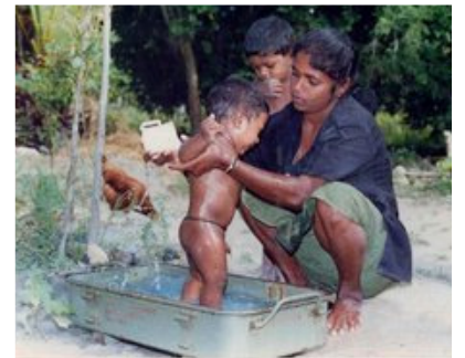
TSUNAMI PHOTO 2