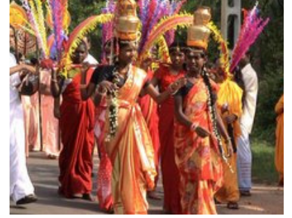
எனது பதிவுகள் 7