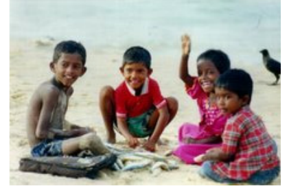
எனது பதிவுகள் 3