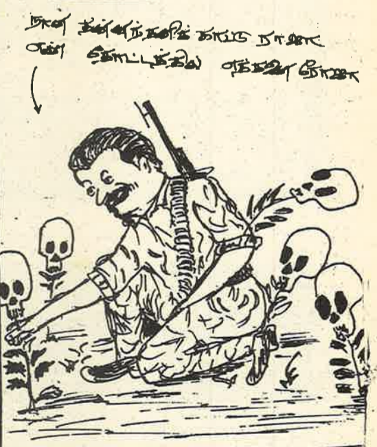
வலதுமேயுள்ளவர் மீது மூன்று...

இனப்பிரச்சனைக்கான தீர்வை அரசு தரப்பில் இதுவரை முன்வைக்கப்படாததோடு, தமிழ்ப்பேசும் மக்களின் சார்பில் ஈழமக்கள் புரட்சிகர விடுதலை முன்னணியினர் இனப்பிரச்சனைக்குத் தீர்வாக முன்வைத்த பத்தொன்பது அம்சத்திட்டத்தையும் கணக்கிலெடுக்காதது அரசுதரப்பிலான தட்டிக்கழிக்கும் அசமர்த்தப் போக்கையே சுட்டிக்காட்டுகாட்டுகிறது. இதுவரைவெராவும் மாற்றுத்திட்டங்கள் எதுவும் முன்வைக்கப்படாதபட்சத்தில் ஈழமக்கள் புரட்சிகர விடுதலை முன்னணி முன்வைத்த பத்தொன்பது அம்சத்திட்டத்தின் அடிப்படையில் இனப்பிரச்சனைக்கான பேச்சுவார்த்தை ஆரம்பிக்கப்பட வேண்டும். அதிகாரப்பரவலாக்கலையும், இணைந்த மாகாணசபையையும் உள்ளடக்கிய பத்தொன்பது அம்சத்திட்டத்தின் பரிணாமவளர்ச்சியாக இன்று தமிழ்கட்சிகள் முன்வைத்துள்ள எட்டு அம்சத்திட்டத்தை அரசு கணக்கிலெடுக்காதது ஏன்?