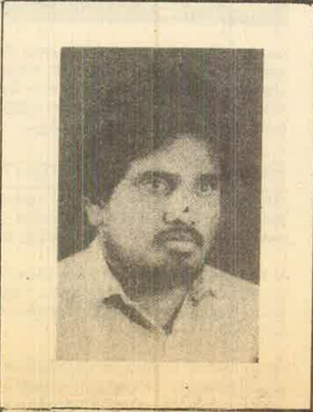
அவ்வாறான முடிவொன்றும் மேற்கொள்ளப்படாமல் போது அதில் உள்ள கஷ்டங்களையும் அதனால் உடனடியாக எமக்கு எதிராக வரக்கூடிய அவப்பெயர்கள் பற்றியெல்லாம் நாம் தெளிவாகவே இருந்தோம். புலிகளிடமிருந்து ஆயுதங்களைக் களையும் கிந்திய சமாதானப் படைபினர்

ஆனால் எம்மைப் பொறுத்த வரையில் உண்மையில் மீண்டும் ஐந்தாய்க்கும் மலர் வேண்டும், ஒவ்வொருவருக்கும் கருத்தை வெளியிடும் உரிமை கிடைக்க வேண்டும் விடும்பிய அனைவரும் விடும்பிய நேரத்தில் பொதுக்கூட்டம் நடத்துவது நினைவுமறப்பட வேண்டும். பத்திரிகைகள் யாரையும் துதிப்பாடாது உண்மை நிலைமையை வெளிக்கொண்டுவரக் கூடிய வாய்ப்பு ஏற்பட வேண்டும் என நாம் விடும்பியோம். அப்படி ஒரு நிலைமையை தோற்றுவிக்க வேண்டும் என்று புலிகளின் கையில் ஆயுதமில்லாத நிலைமையை தோற்றுவிக்க வேண்டும். பாசிச கொலை வெறியர்கள் அடக்கப்பட்ட வேண்டும். அப்போதுதான் அமைதியையும், சமாதானத்தையும் ஏற்படுத்த முடியும் என்று முடிவிற்கு நாம் வந்தோம்.