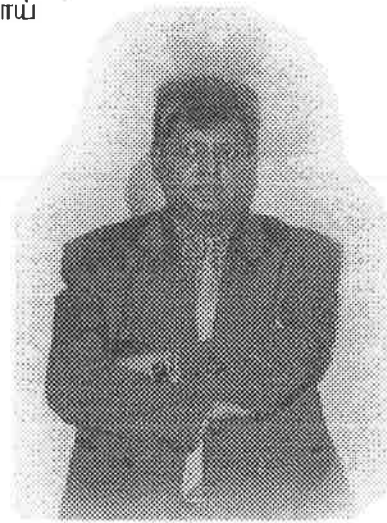
காலம் செல்வம் (கனடா)

பஞ்சிபடா நூலே பலர் நெருடா பாவே பாரிஸில் முரசறைந்த தமிழே போய்விட்டு வா நண்பா.