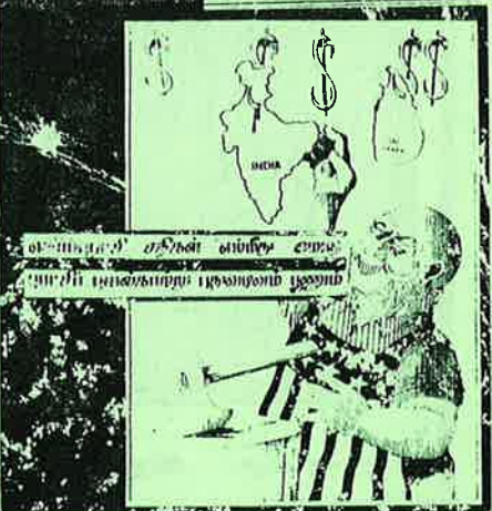
வெள்ளைத் தலை வணிக உலகம் புதிய மாதங்களை நுவலும் நுவலும்