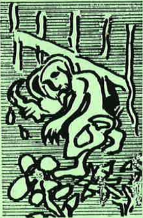
வெலிக்கடை வழிநடிகள் கிழிதலின் கிழிப்புண்கள்