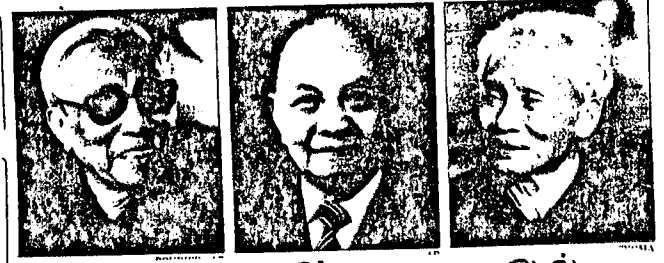
தோழர்கள் வியட்நாம் கம்யூனிஸ்ட் கட்சியின் ஆளுகாட்சியில்.