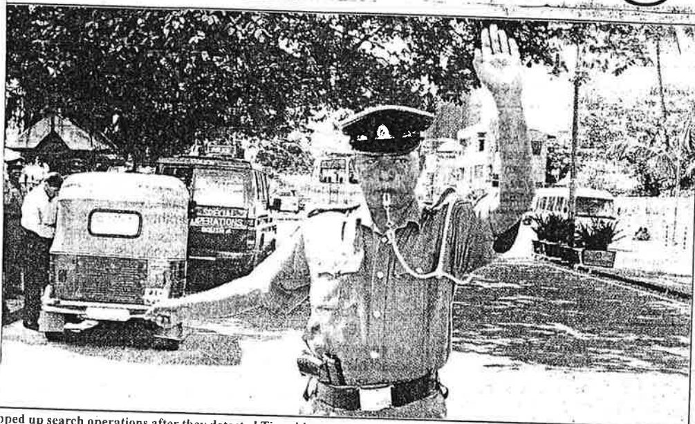
pped up search operations after they detected Tiger hit squads in Colombo this week. In the picture the officers of the spe- unit are seen in action.