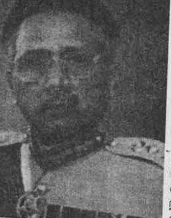
பாகிஸ்தானின் உளவு ஸ்தாபனம் ஐ.எஸ்.ஐ க்கும் இது விடயத்தில் கணிசமான பங்கு உண்டு. மும்பாயிலும், கோயம்புத்தாரிலும் இடம் பெற்ற குண்டு வெடிப்புக்களிலும், இந்தியாவின் பல பாகங்களிலும் இடம் பெற்று குண்டு வெடிப்புக்களிலும் இந்த ஐ.எஸ்.ஐ இன் மறைகாரங்கள் இருந்தன.

இலங்கையில் எவ்வாறு பேரினவாத அரசியல் மாறி மாறி பதவிக்கு வரும் அரசியல் கட்சிகளுக்கு உதவியதோ அதேபோல்தான் இந்திய விரோத போக்கையும், காஷ்மீர் விவகாரத்தையும் பாகிஸ்தான் மக்கள் கட்சியும், பாகிஸ்தான் முஸ்லீம் லீக் கும், இராணுவத்தினரும் தமது நலன்களுக்குப் பயன்படுத்திக் கொண்டனர். அதற்காக அடிப்படைவாதக் கூலிக்குழுக்களைப் பாகிஸ்தானிலும், ஆப்கானிஸ்தானிலும், காஷ்மீரின் உள்ளும் உருவாக்கி வன்முறையைக் கட்டவிழ்த்து விட்டனர்.