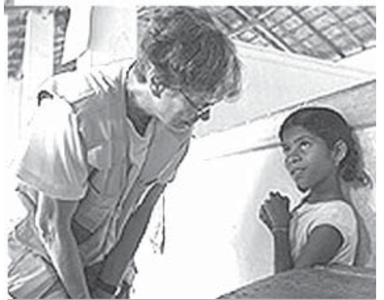
ஐ.நா சிறுவர் நிதியத்தின் பிரதிநிதி சிறுமியுடன் உரையாடுகிறார்

புலிகள் இயக்கமும் அவர்களின் மனிதாபிமான பிரிவான தமிழர் புனர்வாழ்வுக் கழகமும் தமிழ்ப் பகுதிகளில் உள்ள நிவாரணப் பணிகள், முகாம்கள் மற்றும் அநாதை இல்லங்கள் என்பவற்றை தமது கட்டுப்பாட்டுக்குள் வைத்திருக்க மேற்கொள்ளும் முயற்சிகளை முடிவுக்கு கொண்டு வருவதோடு, பக்க சார்பற்ற உள்ளூர் மற்றும் சர்வதேச அமைப்புகள் எவ்வித தங்கு தடையுமின்றி தமது பணிகளை மேற்கொள்வதற்கு இடமளிக்க வேண்டும் என்றும் பிரதம மந்திரி அவர்களைக் கோர வேண்டும் என ஹியூமன் ரைட்ஸ் வொச் அமைப்பு வலியுறுத்தி உள்ளது. அத்தோடு எதிர்வரும் காலத்தில் நடக்கக்கூடிய எந்த விதமான சமாதானப் பேச்சுக்