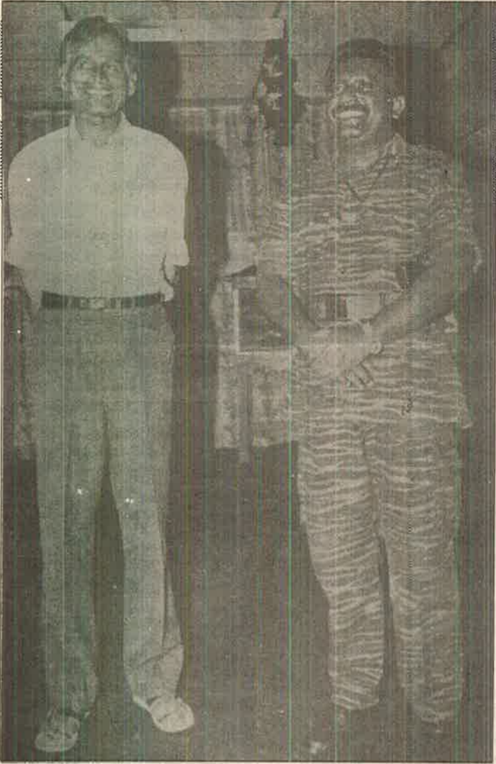
பேராசானுக்கு விருதுகுட்டி மகிழும் பெருந்தலைவன்.