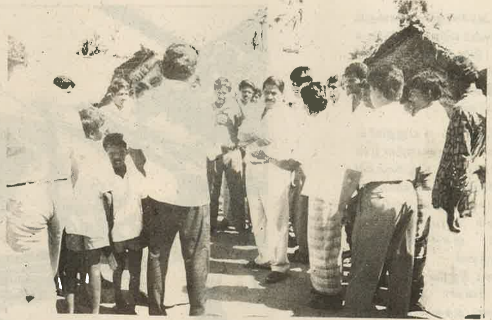
காரைதீவு அகதிகள் முகாமில்...

கலந்து கொண்ட கூட்டத்தில் மக்களின் கஷ்டங்கள், துன்பங்களைக் கேட்டறிந்தார். மாமாங்கம், வீரமுனை ஆகிய