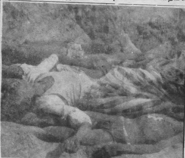
மடங்கரில் எதிரியால் புதைக்கப்பட்டவர்கள்

அரசியல் கைதிகள் எவரும் 18 மாதங்களுக்கு மேல் விசாரணை இல்லாக் கைதிகளாகச் சிறையில்