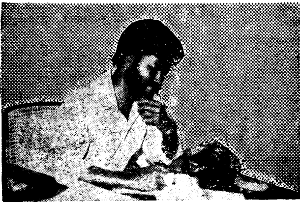
தோழர் க. பத்மநாபா

மேலும் அச்செய்தியில் இந்தியாவின் நட்பையும் மீறி நாங்கள் போராடுவோம் என்று யாராவது கூறுவார்களாயின் அது எமது இன்றைய யதார்த்தத்துக்கு புறம்பான அதீத துணிச்சல் மனோபாவத்தின் வெளிப்பாடேயாகும். அவ்வாறான நினைப்பானது ஒன்றில் எம்மை அழிவுப்பாதைக்கு இட்டுச் செல்லும், நீண்டகால அடிப்படையில் ஈழப் போராளிகளை பிற்போக்குவாதிகளின் கரங்களில் வீழ்த்திவிடும். ஈழ மக்களின் நலனும் இந்தியாவின் நலனும் இந்துமக்கடல் பிராந்திய நலனும் பிரிக்கப்படமுடியாதவை. எமது போராட்டத்திற்கு எதிரான சில தீய சக்திகள் இந்தச் சந்தர்ப்பத்தில் நல்லவர்கள் போல் நடந்து உங்கள் சிந்தனையை குழப்பக்கூடும். அவ்வேளைகளில் நீங்கள் மிகவும் எச்சரிக்கையாகவும், விழிப்போடும் இருக்க வேண்டும் என்று கேட்டுக் கொள்கிறேன்.