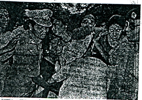
பெயரானால் பெற்ற பயிற்சிக்குப் பிறகு சென்னை நிறம்பிய பத்மநாபா ஊட்டி, கொடைக்காணல் பகுதிகளில் வந்திறங்கிய இலங்கை அகதிகளின் மறுவாழ்வுப் பணிகளில் ஈடுபட்டார். அதற்குப் பிறகு 78-ம் வருடம் இலங்கையில் கிழக்கு மாகாணப்பகுதி கடும் வெள்ளத்தால்